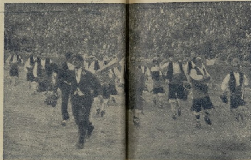
Son indudablemente los de Aragón, lo van demostrando en cuantas plazas actúan. / ¡Si viera su «grasia» Don Mito de Caval ! ¡Menuda crónica que les hubiéramos dado!