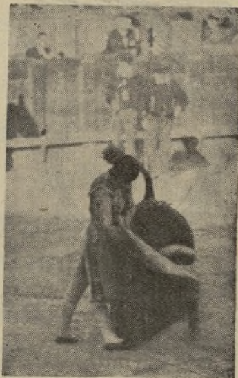
MARAVILLA toreando a la verónica y pisando un terreno inverosímil. El jueves último, toreó en Granada armando un gran «spoilium» , pues cortó orejas y fué sacado en hombros. Hoy torca en Cádiz, el próximo domingo en Zaragoza, y así hasta agosto que será malador de toros, y de los más caros.

Los nuevos sapos taurinos asoman ya la cabeza... No me haga usted de reír, que tengo el labio partido.