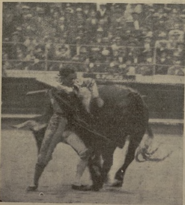
Metléndose dentro del toro en un molinete espeluz-nante. Esc es, quieran o no, el siempre joven maestro, que lo mismo torca al natural de manera impecable como molinetea cuando llega el caso. / MARCIAL reaparecerá pronto en Madrid y la fecha tendrá ca-rácter de acontecimiento.

Hemos leído en "A B C" del vier-nes un anuncio que dice: "Mar-quez y el pueblecito de su ma-dre". Véase esta crónica de Gregorio Corrochano en el pró-ximo número de "Blanco y Ne-gro". ¡Eh! ¿Qué tal? Tenemos la completa seguridad de que si Marquez viste de nuevo, como se dice, el traje de luces, el hijo del revistero del diario de la calle de Serrano será enrolado en alguna combinación con el Belmonte rubiales. La crónica, que aún no conocemos, y que llegará al corazón del madrile-ño torero, se traducirá en eso: en una corrida para "Casca-rrias" exigida por Marquez. Esto es muy humano, pero "Don Gregorio" no debe alardear, como lo ha hecho, de que está al margen de los asuntos tau-rinos de su hijito.