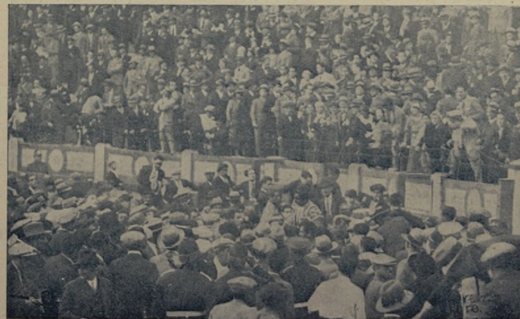
Tardes gloriosas de triunfo. ARMILLITA CHICO aclamado y paseado en triunfo por el «tapiz» del tauródromo madrileño. El público, abarrotado en el tendido, comenta vívidamente las faenas que el mejicano acaba de realizar. ARMILLITA CHICO salió así de la plaza madrileña innumerables veces, y este mismo año, recientemente, confirmó sus excelentes condiciones de extraordinario y completo lidiador. / ¿Por qué pues ARMILLITA CHICO no torca en nuestro tauródromo con más frecuencia? Los públicos de provincias también conocen los puntos que calza, como artista, FERMIN .