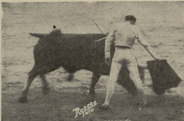
Un mulcazo mandon y personalísimo de VICTORIANO DE LA SERNA. Naturalidad y firmeza. No torca sobre la punta de los pies y lleva al toro, en la muleta «embebido» a lo largo del brazo. Como ustedes ven, el arte de Don Victoriano, es exclusivamente suyo y no tiene que patentarlo. ¡A ver quién es el guapo que intenta falsificarlo!

Cuando por segunda vez salía el torero a los medios empujado por el aire de los aplausos, todavía el pasodoble decía sin cansarse: "Marciaa! es el más grandeeeee..." Yo había oído este pasodoble otras veces en las gramolas de los cafés. Y me pareció una música ruidosa y sin sentido. Pero en la plaza de toros, con el público de pie en los tendidos, las mulillas al galope, el surco del toro de la oreja cortada y el torero con su cortejo de palmas, el pasodoble era un acierto. Y es que indudablemente el pasodoble de los toreros se inspiró en la plaza y para la plaza se escribió."