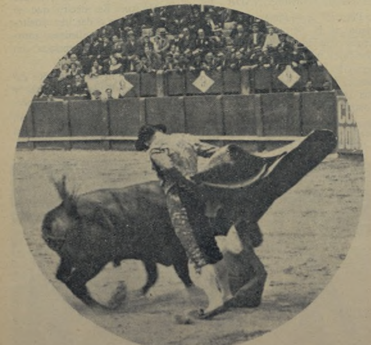
DOMINGO ORTEGA , el brillante de Borox, el torero “de la armonía”, ejecutando su famoso quite, en el que los pitones de los cornudos, le escatabajan las chorreras de la camisa. Pese a los «derrotistas» taurinos, el famoso lidiador toledano, continúa «pisando fuerte», colocándose cerca del toro en terrenos inverosímiles, y derrochando el valor por toneladas. Su arte limpio como la luz del Sol, entusiasma a los aficionados que le aplauden frenéticamente y sonriendo de los pobres «derrotistas».