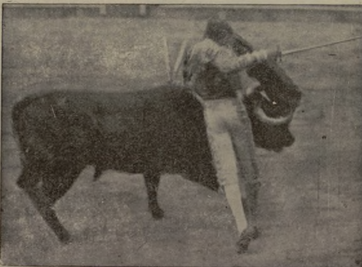
«ARMILLITA CHICO» echándose el toro por delante en el pase de pecho. Van serenándose las aguas y parece ser que al fin habrá arreglo. Que así sea, porque los aficionados aún saborean la magnífica faena que hizo con el toro, en el tauródromo madrileño hace breves días.