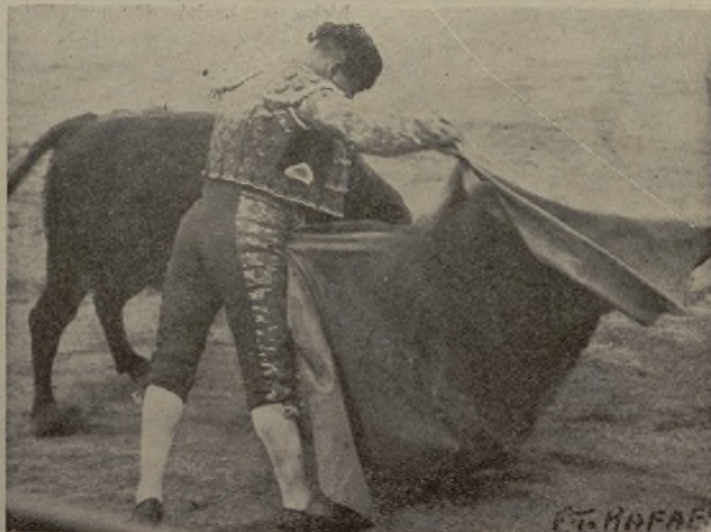
El «NIÑO DEL BARRIO», vuelve a la plaza de sus triunfos en la presente temporada. Vista Alegre. Este «NIÑO» lo es ya con toda la barba, porque torca como un señor mayor y puede llamar de tu a los mejores novilleros.

¡A pesar de algunos trabajos de zapa que se han hecho para desvirtuar este último triunfo del novillero que en breve será doctorado con todos los honores, como corresponde a un torero de tal categoría.