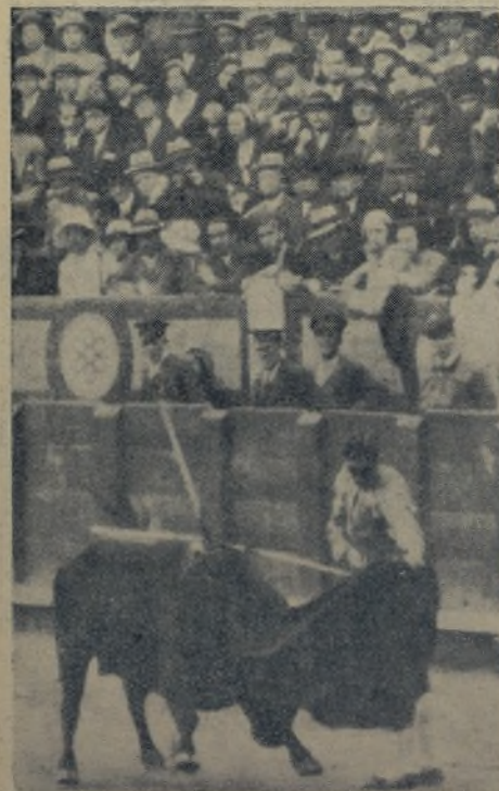
El siempre joven maestro torcando al natural con naturalidad. ¿Quién fué el que escribió que MARCIAL daba el pase natural «desnaturalizado»? La «foto» es de Madrid y de su último trinfo precisamente, ¡Pues dijo una tontería!

No le rodó la pelota al joven maestro el jueves último en Madrid. Pero, ¿y aquellos preciosos quites, vistosos, variados y emocionantes que entusiasmaron al público? ¿Y aquel otro con el que salvó la vida de un piquero? ¡Los grandes maestros, cuando torear, siempre dejan algo hecho para que aprendan los demás!