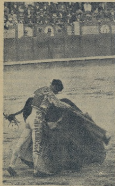
«EL ESTUDIANTE» que ya es doctor. Pero no doctor efectivo, como lo creía justificado en todas sus actuaciones al lado de los llamados figuras. El último domingo en Barcelona, con su valor levantó al público de los asientos, con su peculiar estilo de torcar.

No le rodó la pelota al joven maestro el jueves último en Madrid. Pero, ¿y aquellos preciosos quites, vistosos, variados y emocionantes que entusiasmaron al público? ¿Y aquel otro con el que salvó la vida de un piquero? ¡Los grandes maestros, cuando torear, siempre dejan algo hecho para que aprendan los demás!