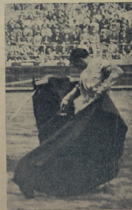
EL BRILLANTE DE BOROX, en uno de los momentos más culminantes de sus formidables faenas de muleta. Después de su éxito enorme en Madrid el jueves último suponemos enmudecidos a todas las coraceras taurinas.

Hoy reaparece en la plaza de toros de la capital de la República el enigmático torero, el Fakir de la tauromaquia, Victoriano de la Serna. Hará que se desaten las pasiones y que los comentarios sean para todos los gustos. ¿Que fuerza misteriosa posee este lidiador, que atrae, fascina y subyuga con su único y personal estilo a la afición?