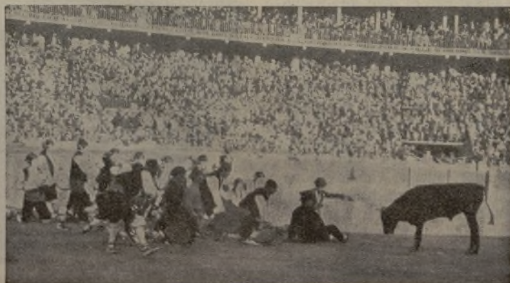
Un momento interesante de la formación cómico taurino LOS DE ARAGON, que no cesan de recorrer las plazas de triunfo en triunfo. / Y a propósito. ¿Cuándo se presentan LOS DE ARAGON en Madrid? ¡Porque ya se está mascando el éxito!

Por efecto de una recomendación de esas de aúpa, que cayó sobre el empresario de Barcelona como una losa, toreó el domingo último en la Monumental Manolo Rodríguez "Castrelito". El muchacho (¡bueno, está de muchacho es un decir!) demasiado hizo con enviar al desolladero a los dos morlacos que le correspondieron.