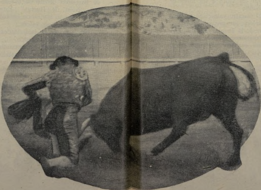
El que a los once años de alternativa, no se dejó ganar la pelca por nadie, figura este año en todas las ferias importantes de España, dato que no debe olvidarse. Torca por todos los estilos y cuando se arroja ante los toros, es para torcar, no para tirar pegos a la «galera», sin pinchar las rómulas sobre la arena, después de haber pasado los pitones, como otros hacen. Éste es MARCIAL LALANDA!