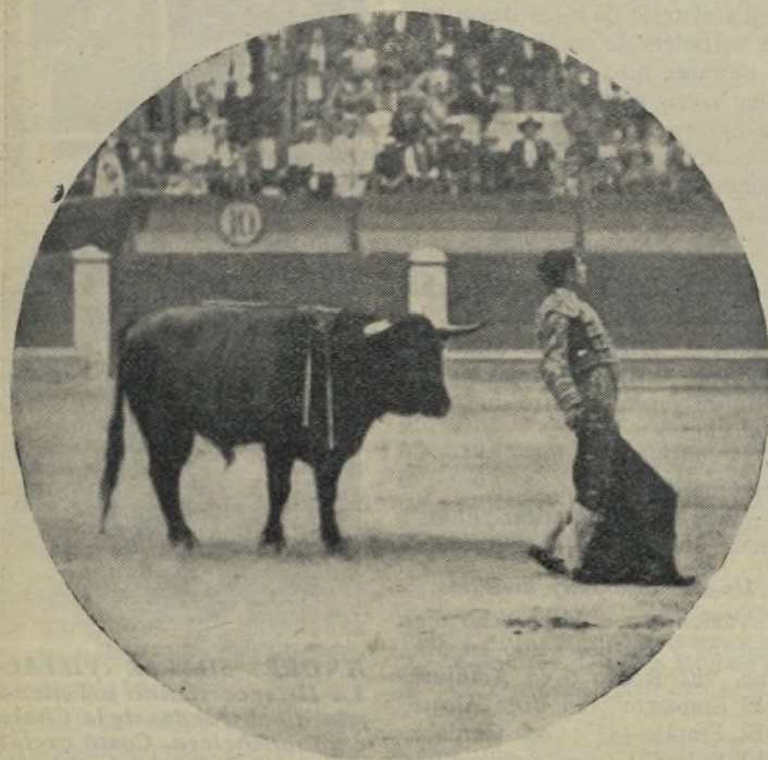
VICENTE BARRERA, el gran maestro valenciano, el que fascina, subyuga y domina a los toros con su mágica muleta. En plan de cortar orejas donde torca, el pasado domingo en Cádiz desorejó dos toros y se llevó por unanimidad la placa de plata otorgada por la prensa gaditana.