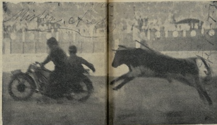
Emocionante momento del rejoneo en moto. En Alicante, mister Sagrab y mister Aresio obtuvieron un señalado triunfo pocos días. La suerte novísima viene a tirar un «rentoy» a los rejoneadores modernos. Hoy las ciencias adelantan, que es una «barbaridad»! Señores, el dir-ittk taurínico se impone, y la novedosa suerte viene a sustituir a la suerte de «v». ¡El castoreño y la mona será en breve sustituido por el cab de acero y los leguis!!