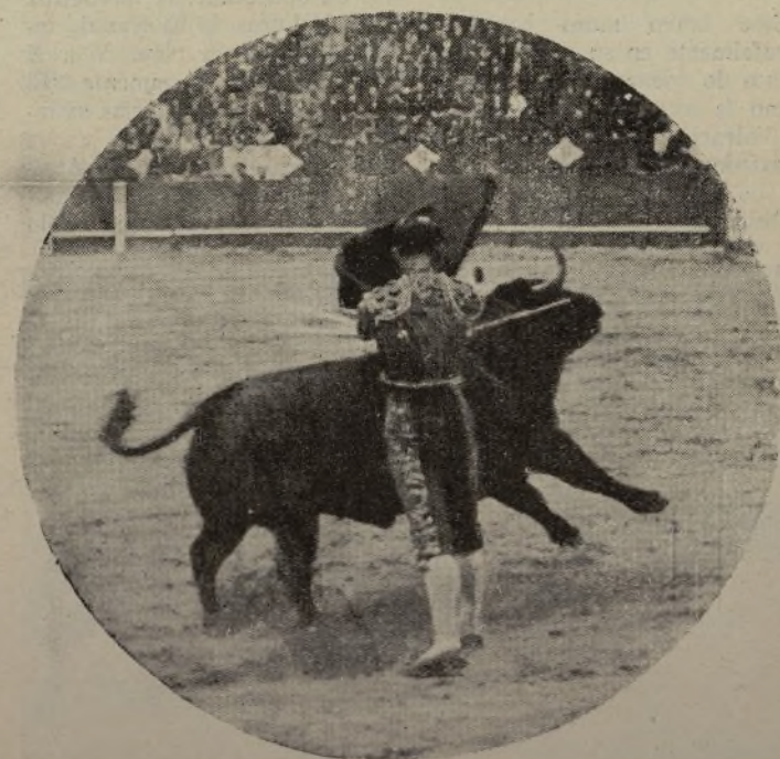
El Brillante de Borox, que digan lo que digan lo que quieran las crónicas, continúa pisando fuerte terrenos inverosímiles cerca del toro. A ver quién es el guapo que le quita el sítio. ¡Ortega, Domingo Ortega...!