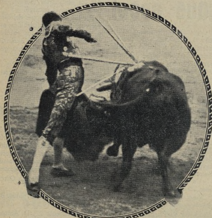
Este gran torero, este gran maestro que se llama MARCIAL LALANDA, toró su última corrida esta temporada el 17 del pasado en Zaragoza, la plaza de sus triunfos. El momento que reproducimos es de los que acreditan una vez más su arte al matar con la mano izquierda.