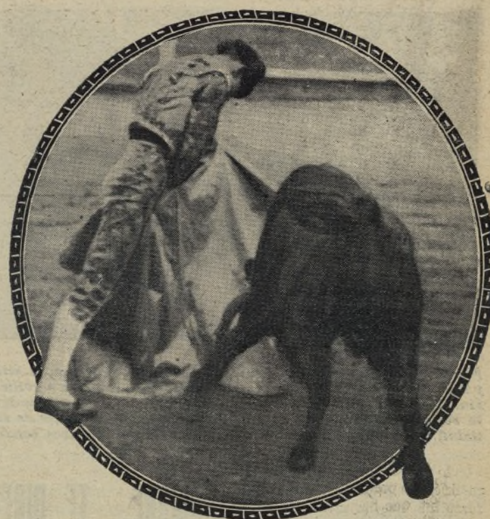
DOMINGO ORTEGA, 'El Ilustre palcio', como le llaman en Salamanca, terminará esta temporada con más de un centenar de corridas torcadas con otros tantos éxitos. Domingo Ortega ha triunfado en Sevilla en el preciso momento donde aquella afición anda desorientada.