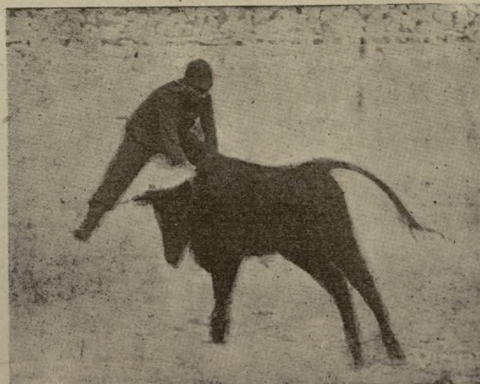
El saladisimo «Bombero Torero», de la troupe que acudilla LLAPISERA, en un formidable par de banderillas cortas al salto, que es la admiración de niños, militares sin graduación y personas mayores. Ayer toreó la agrupación Llapisera LOS CALDERONES en Valencia, hoy en Murcia y mañana en Caravaca, con éxito de taquilla y artístico. Así presume el tío largo de fincas, ¡jayeres! y sombrero de copa.

Este invierno, a seguir estudiando en Suiza.