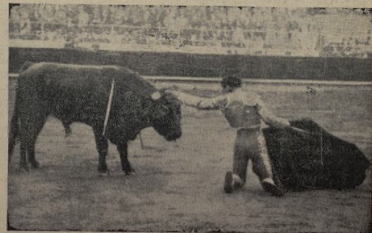
CHIKUITO DE LA AUDIENCIA, el fino torero madrileño, en un momento de alarde y dominio con la muleta, después de haber formado una polvareda, y grande, toreando al natural de manera prolija. / 'Chiquito de la Audiencia' es de los toreros que con un solo toro hace una temporada a más corridas que nadie.

Quien no haya visto a "Maravilla" de matador de toros no puede darse cuenta de lo que di-