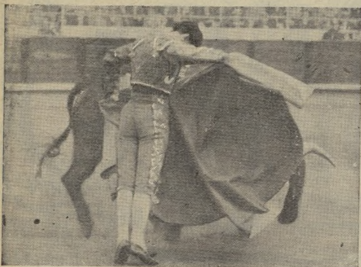
VICENTE BARRERA, el maestro valenciano, dibujando un lance con el capote. Mañana lunes torca en Guadalajara, y tengan ustedes la seguridad de que la que va a formar con los de Alipio va a ser de las que harán época, porque el maestro está que «jumea» de valiente.