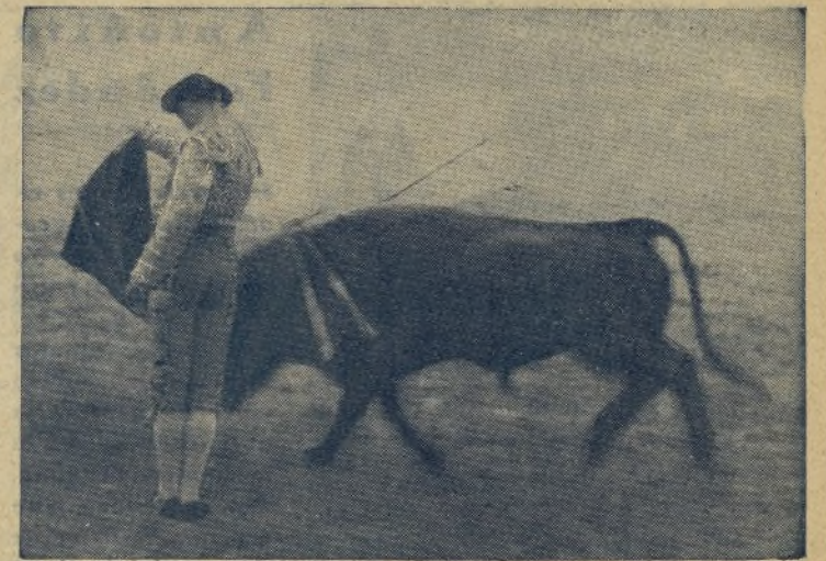
Ha vuelto a actuar en Caracas PEPE AMOROS y ha vuelto a triunfar ruidosamente, porque cuando se sale dispuesto a ello no hay toro malo ni compañero que sea bueno. A Pepe Amoros le han ampliado su contrato nuevamente. Esto es una prueba más que evidente de su triunfo.

Total, que de una manera o de otra la formalidad ya está en entredicho. ¿Estamos?