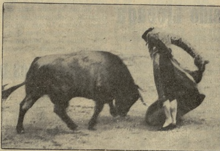
VICENTE BARRERA, el gran torero valenciano, en un momento de su arte con el capote. / VICENTE BARRERA está recibiendo ventajosísimas proposiciones para actuar todo el mes de Enero en Caracas y es de esperar que, dado los ofrecimientos tan tentadores, el torero valenciano se decida a pasar el charco.

Por lo menos, ya ha quitado en la feria los puestos a otros