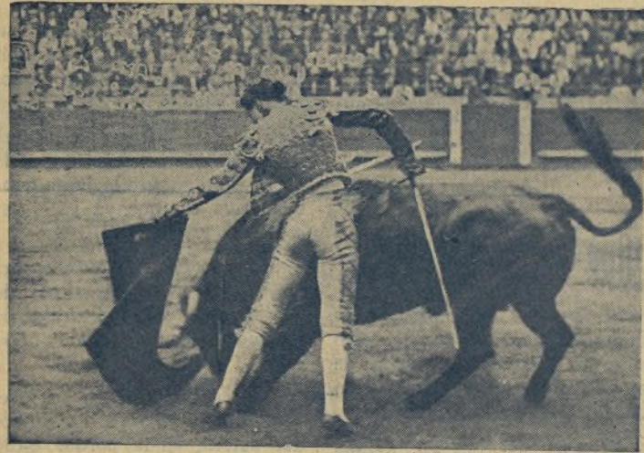
Este gran torero ya ha debutado en Méjico, y su éxito ha sido tan extraordinario que ya no se habla de otra cosa que EL ESTUDIANTE en la patria de Gaona. Claro que si ha torcado como lo está haciendo en esta foto no tiene nada de particular