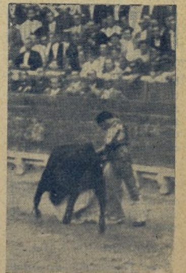
ANTOÑETE IGLESIAS, que ha terminado la temporada con un chaparrón de corridas firmadas para la próxima y con una gran cantidad de orejas cortadas en cuantas corridas actuó. ¡Toreando así no hay más remedio que triunfar, señores aficionados!