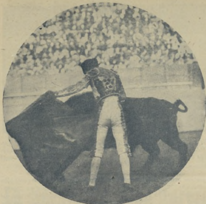
El que torca con el capote como lo hace LUIS GOMEZ «EL ESTUDIANTE», tengan ustedes la seguridad de que tiene ustia en el torco. El bravo matador madrileño está siendo objeto de grandes ovaciones en Méjico, por su sello personalísimo con el capote y con la muleta y sus arranques a la hora de la verdad. EL ESTUDIANTE, con su valor frío y su arte, llegará a donde le de la escalilla gana.]