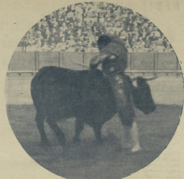
PEPE GALLARDO, el bravo mozo de Chiclana, en un momento de su arte y valor con la muleta, que le ha proporcionado tan ruidosos triunfos en cuantas corridas actuó la pasada temporada. PEPE GALLARDO es el matador de toros que por su estilo propio y sus formidables volapiés será este año la atracción de las corridas de feria.