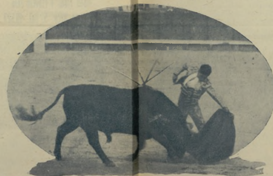
JOSELITO BIENVENIDA, el joven matador sevillano, en un momento de su arte con la muleta en la mano izquierda, que le coloca al nivel de las grandes figuras del torero. / Joselito Bienvenida va ha esta temporada a los ruedos dispuesto a colocarse a la cabeza de la torería, y como la suerte le acompañe un poquito tengan ustedes la seguridad de que lo conseguirá, pues no en balde es de los más completos de cuantos pisan las plazas.

muchas planas en color y otras varias en colores componen tan brillante número que será seguramente el mejor de cuantos se han publicado de veinte años acá.