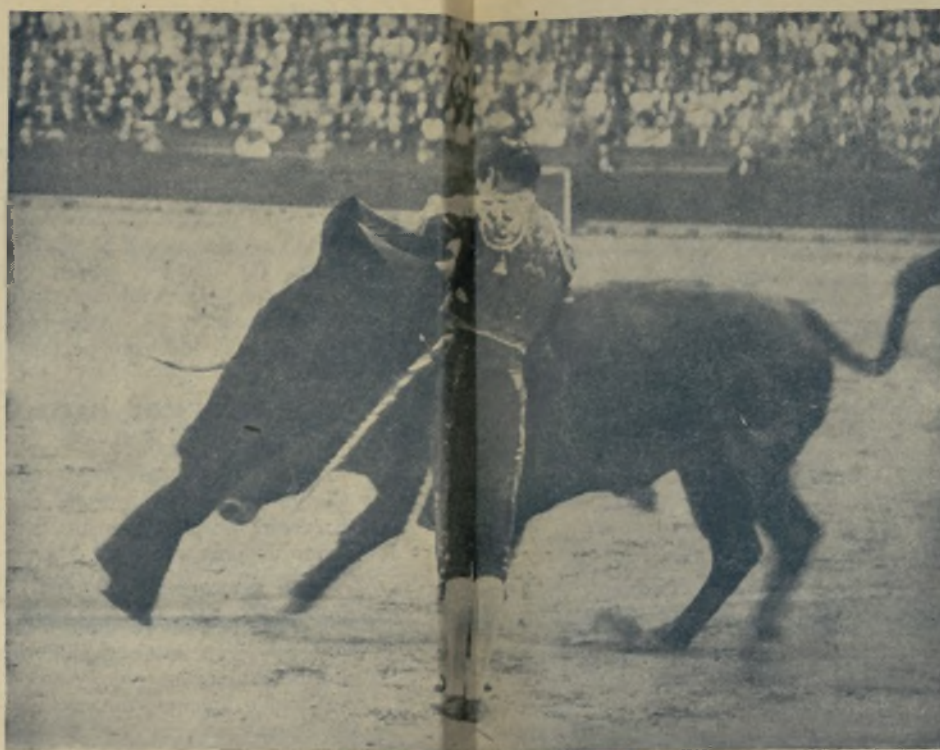
VICENTE BARRERA, el genial muletero valenciano, en un momento de su arte indiscutible con la muleta que lo justifica todo y lo dice todo. VICENTE BARRERA terminó una temporada brillantísima y por los comienzos que tiene ésta, será una continuación de la que ya pasó.

Junta el toro las manos. El público no quiere que acabe aquella borrachera de belleza y de ilusión. El torero arranca a matar. Baja la mano, arrastra la pierna