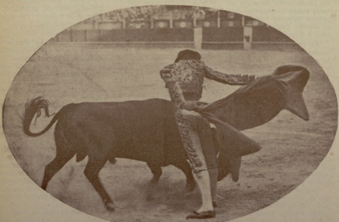
ARMILLITA EL SABIO , el más joven y el más diestro de los toreros mejicanos, el que ha conseguido levantar en su país la afición de tal manera, que se compara sólo a los tiempos de Gaona, Belmonte y Mejías. * ¡Como que es un artista!