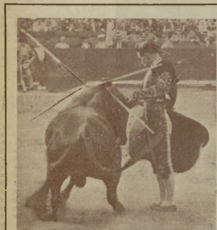
NIÑO DE LA PALMA , el torero de los grandes escándalos, que está dispuesto esta temporada a que sus actuaciones se comenten de la misma manera que se comentó la última de Madrid.