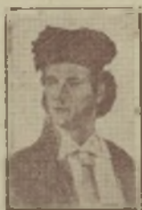
Francisco Montes (Paquiro), 1838.

De que el toro tenga la cabeza descompuesta tienen por lo general la culpa los mismos lidiadores.