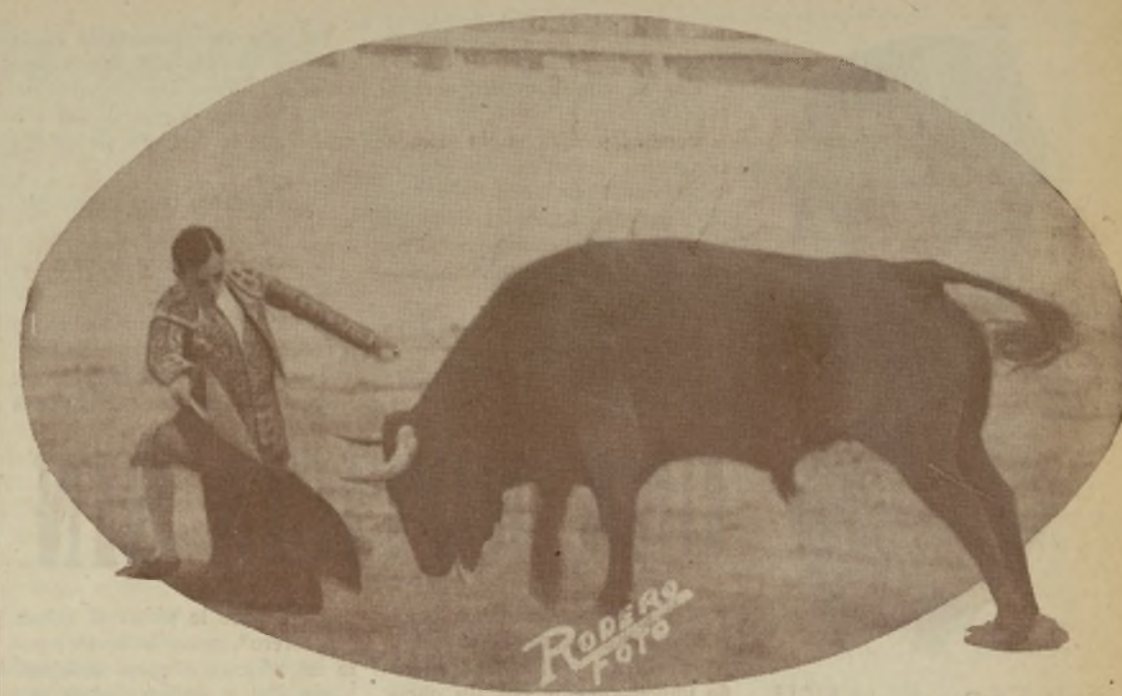
MARCIAL LALANDA esperando rodilla en tierra a que pase todo el toro embebido en los vuelos de su mágica muletilla, la única que se pasea dignamente enarbolada en la mano izquierda por los ruedos taurinos.