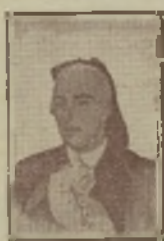
Pedro Romero, 1801.

Parar los pies y dejarse coger, ese es el modo de que el toro se consienta y se descubra bien para matarlo.