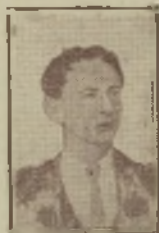
Antonio Sánchez (el Tato), 1860.

La fama se encarga de que no sea sordo el torero, a quien los aplausos no le alienten ni los silbidos le acobarden.