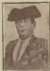
Arjona Herrera (Cúchares), 1850.

Hablar de toros es cosa fácil; saber lo que se dice, esa es harina de otro costal.