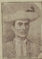
Francisco Calderón, 1878.

El hombre a caballo debe mostrar más que fuerza bruta inteligencia y habilidad. Con sólo aquélla no pueda vencer al toro; con las últimas se le vence siempre.