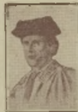
José Redondo (Chiclanero), 1850.

El que toma un oficio debe aspirar a ser en él capitán general y si no dejarlo. Quiero mejor arrancar por fuerza un aplauso a mis enemigos, que no diez mil vitores de mis partidarios.