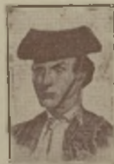
José Calderón (Capita), 1849.

Ninguna cosa hecha de prisa puede salir bien. Más vale dejar de hacer una suerte que ejecutarla mal. No es valiente el temerario, sino el que espera tranquilo el peligro.