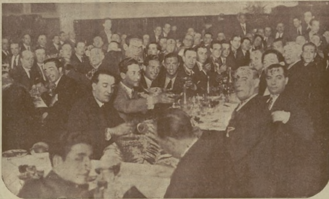
Este brillante aspecto ofrecía el suntuoso salón del Hotel Victoria, donde se celebró el pasado Miércoles nuestro homenaje. Periodistas, toreros, aficionados y cuantos aman la fiesta nacional tuvieron su representación.

Muy Sres. míos: Como ya indiqué hace días al Sr. Becerra, salgo de viaje hoy, y me priva