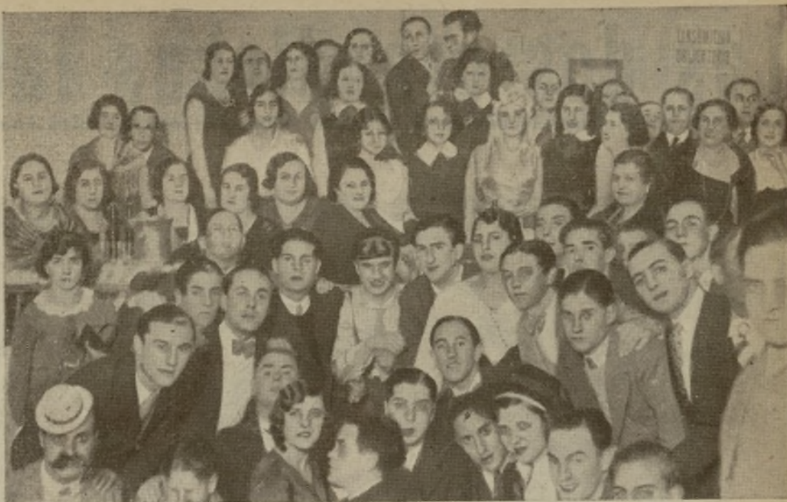
DE NUESTRO HOMENAJE A «MISS MADRID» EN EL BARCELÓ. Uno de los palcos en el que se apiñaban las chicas más guapas del salón y los chavales más alegres y divertidos de la velada, que fueron el «clou» de la fiesta y del movimiento continuo hasta que ya empezaba a rayar el día.