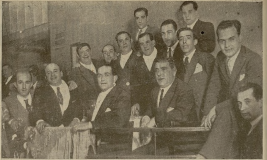
DE NUESTRO HOMENAJE A «MISS MADRID» EN EL BARCELÓ. Apoderados, periodistas y toreros serios y cómicos, están en este grupo que muerden por lo bonitos y por lo bien «plantaos». Claro que a la madrugada se había acabado la seriedad y el Bombero no hacía nada más que apagar fuegos... de alcohol.

Nos comunican desde Sevilla que la inclusión de "Maravilla" en los carteles de Feria ha caído