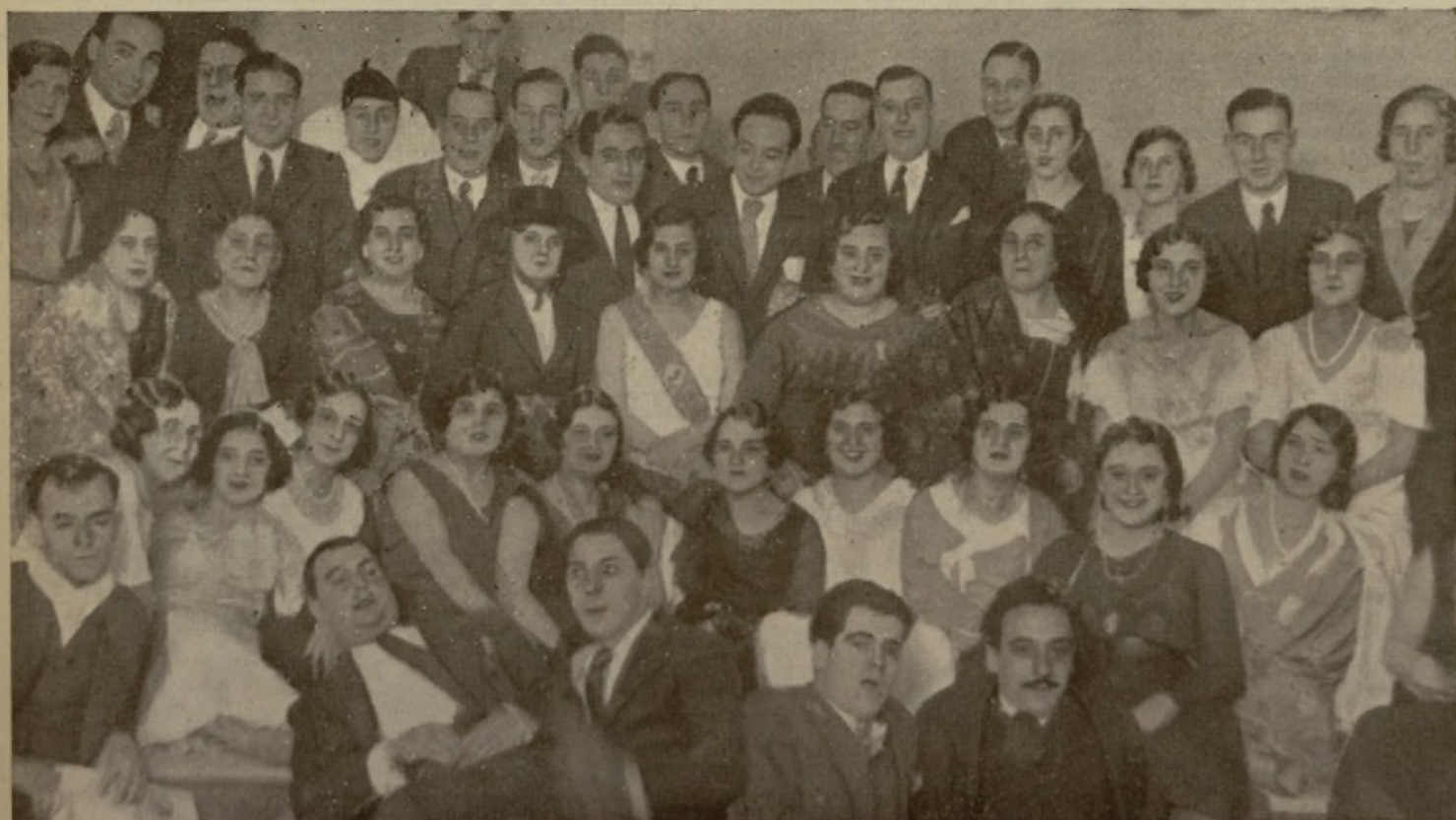
DE NUESTRO HOMENAJE A «MISS MADRID» EN EL BARCELÓ. - Un alto en el baile sirvió para que Mari, el fotógrafo de la vista cansada, organizase este grupo, donde se ve a «Miss Madrid» rodeada de admiradores y teniendo a la retaguardia lo más travieso de la reunión y alguno que otro cuarentón que no se despegada de nuestra paisana ni un momento siquiera.