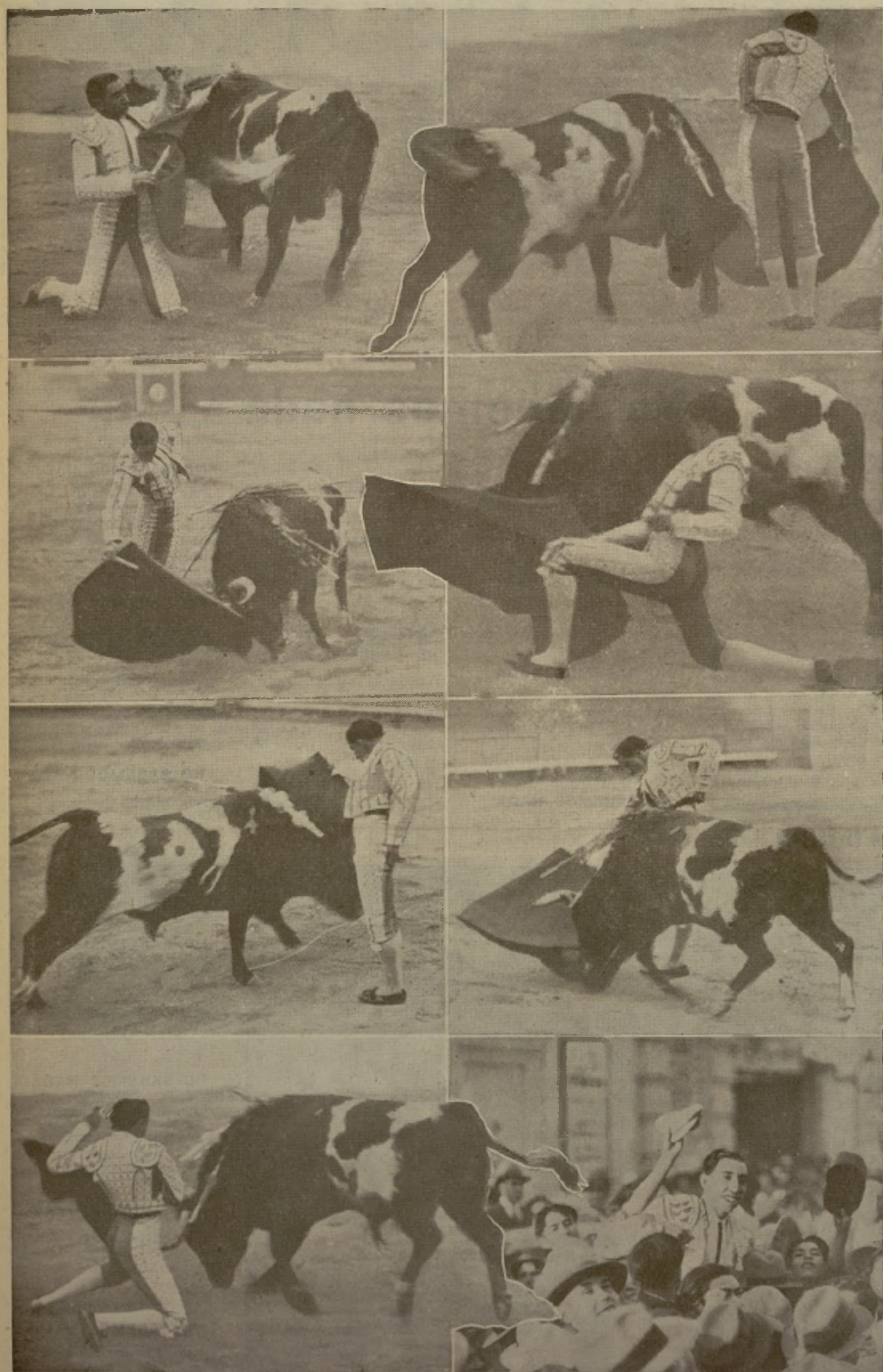
Estos momentos que reproducimos pertenecen al gran artista, de Saltillo, Fermín Espinosa en el toro "Pestño" de la ganadería de Piedras Negras, y en ellos se ve al torero que sabe, puede y hace de los toros, con su arte puramente jofelista, lo que quiere; ya comprenderán ustedes que le cortó las orejas y que al final se lo llevaron en hombros.