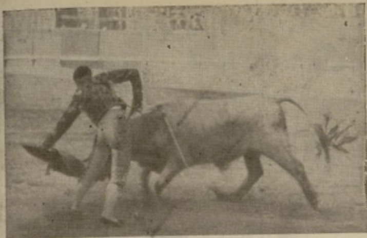
EL CHICO DE LA BOTICA. Novillero zamorano que se reveló la temporada pasada como un excelente novillero, y esta está poniendo a caldo a los que con él alternan en los tentaderos salmantinos.