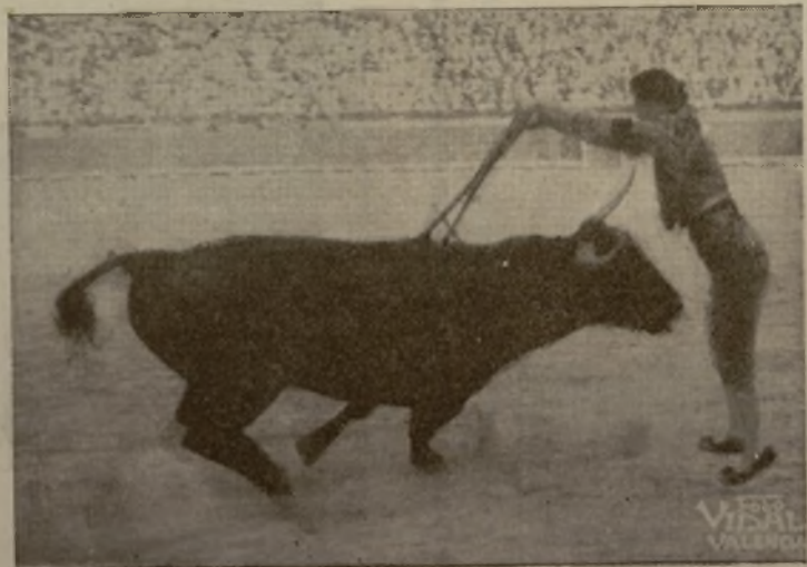
Este formidable par de banderillas pertenece al arte de Marcial, el joven maestro, que hoy empieza su temporada en la plaza de Málaga, donde seguramente será con éxito, pues Lalanda, sin bombos de entrenamiento, sale siempre de los ruedos mejor que otros.

Bien, Pepe Amorós; así se triunfa y así es como se puede codearse dignamente