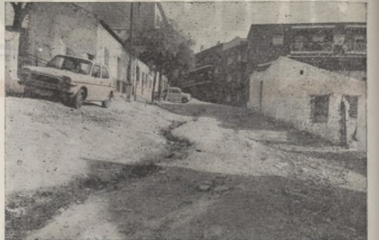
Una de las llamadas calles de San Matías. Detrás de los árboles, el bar "El Descanso", donde quedó constituida la Asociación.

El pasado 25 de enero fue una fecha histórica para "La Unión de Hortaleza". Quedó constituida una nueva Comisión de barrio: la del barrio de San Matías en el viejo pueblo de Hortaleza. Por fin en el pueblo que da nombre a la Asociación van a desarrollarse de una forma organizada las tareas asociativas.