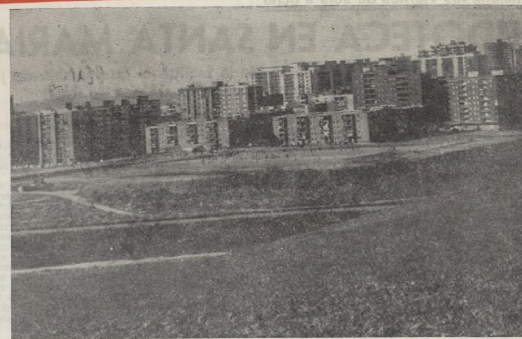
Los barrios se detienen por el momento en la vía del tren. Al fondo Villa Rosa y su polideportivo.