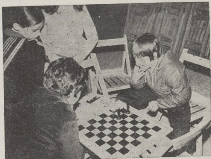
Cualquier sitio es bueno para jugar. Los chavales se entrenan resolviendo un problema de ajedrez.

A finales del pasado mes de diciembre terminó el I Campeonato Infantil de Ajedrez LA UNION DE HORTALEZA, cuya clasificación quedó como sigue: