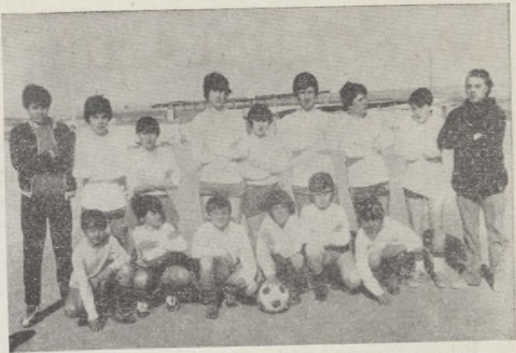
Equipo alevín de San Matías.