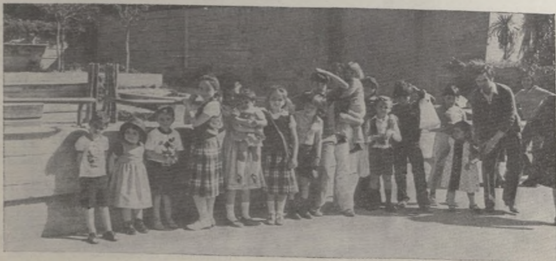
En la foto podemos apreciar el momento en que parte de los niños, y algún mayor, visitan el stand de los tigres.

al ambiente reinante durante la visita, con el especial entusiasmo de los niños en las visitas a las dependencias de los monos y elefantes y zoo chico, aunque nos hubiera gustado contar con una mayor afluencia de asistentes.