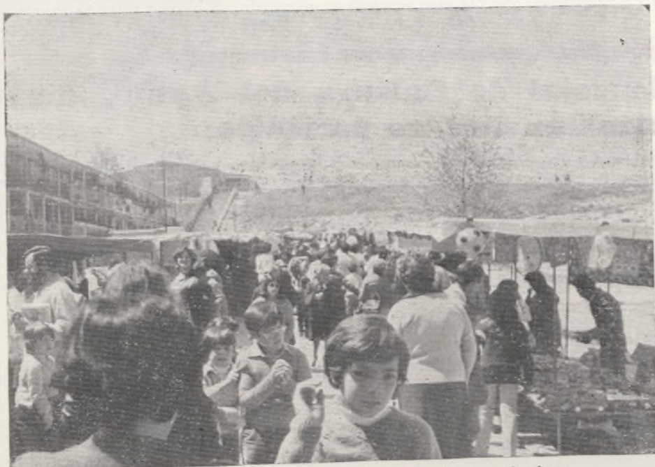
Panorámica de nuestro "rastrillo" cualquier mañana de domingo.