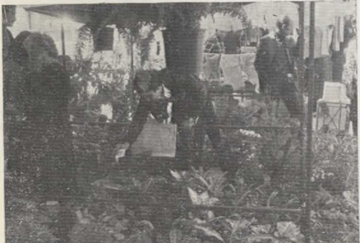
Mil flores para adornar mil casas de nuestro barrio. Vendedores amables, clientes insatisfechos.