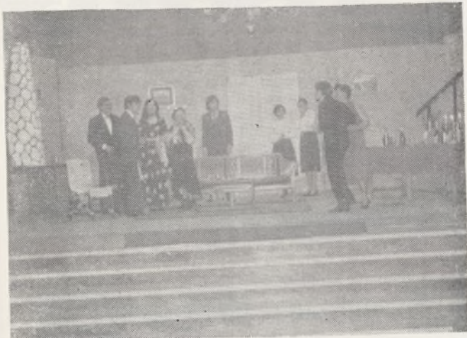
Un momento de la actuación de Grupo 15

El pasado día 23 de marzo, domingo, tuvo lugar en el Hogar Clara Eugenia la representación a cargo del grupo Proyecto-15 de la famosa obra de Alejandro Casona «La tercera palabra». La obra se prestaba a una bonita representación con toda su abundancia de matices que hacen de la obra una gran pieza teatral; pero hablar de obra y autor tan conocido como Alejandro Casona sobre el que tanto se ha escrito y hablado es en este caso secundario. La afluencia del público fue inmejorable, del aforo total del teatro —unas 600 plazas— apenas quedaba libre una veintena y me sorprendió encontrarme con un público que estaba nervioso ante la representación que iba a tener lugar. El ambiente era insuperable y en él flotaba un algo extraño que no aparece en ninguna representación normal, porque aquello no era simplemente una representación teatral, sino una auténtica reunión vecinal donde unos eran actores y otros eran público.