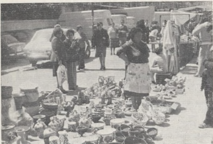
Cerámica de Valencia. Gitana de categoría. Botijos, macetas y cuencos de colores baratos.

Tampoco tienen suerte los artistas. Están tendidos en el suelo, leyendo. No quieren gritar su mercancía. «El arte no necesita de gritos, debe ven-