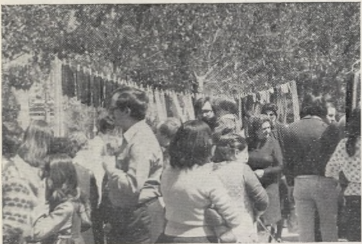
Calcetines colgados del cielo de Hortaleza.