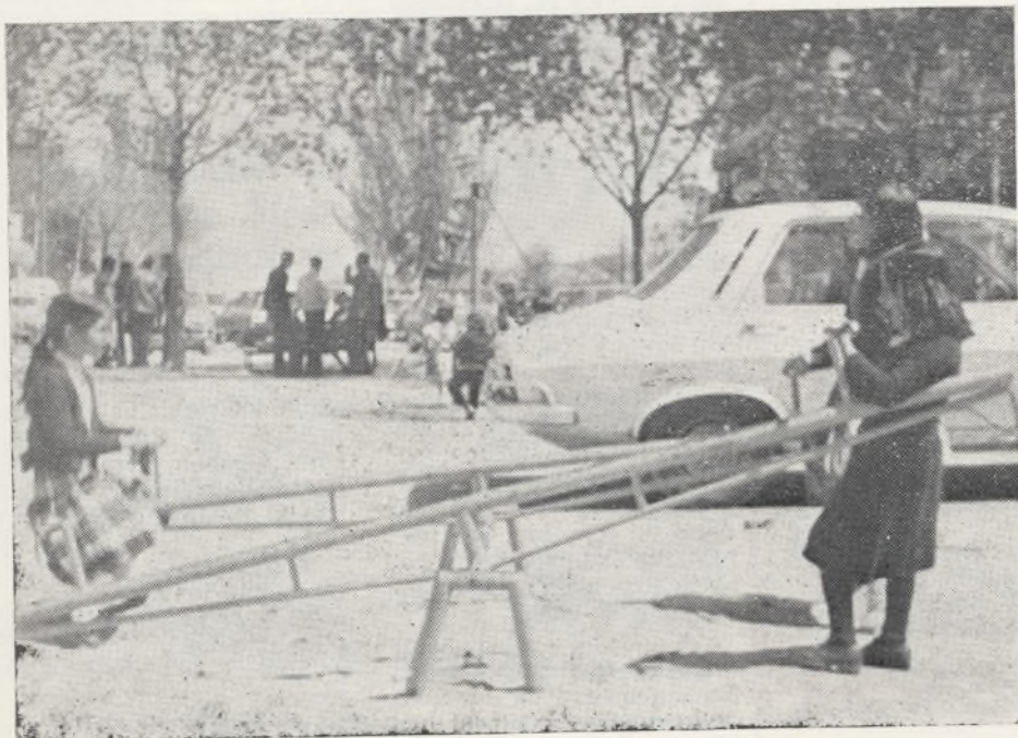
Aparcan en los columpios.