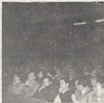
En las fotos, dos aspectos parciales de la mesa que presidió la Asamblea, así como de los socios asistentes a la misma.