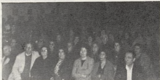
Aspecto que presentaba la Iglesia de UVA, en la Asamblea que celebraron sus vecinos.

Celebraron una Asamblea, con asistencia de unos 800 vecinos.