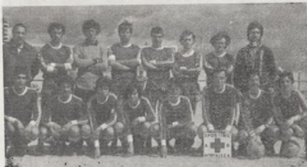
Equipo actual de la A. D. Spórting Hortaleza.

A pesar de la buena situación deportiva en que se encuentra su equipo senior, hay graves problemas internos.