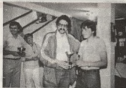
3 Clasificado, Trofeo Joyería Sta Maria, MORATALAZ.

Es de destacar en este torneo, la calidad de juego empleado por los conjuntos en liza, resultando en el equipo de la CAJA DE AHORROS, justo merecedor del triunfo. Es de destacar también los fallos en la organización de los encuentros, pero disculpables por ser esta la Primera Edición del Torneo. Solo queda desear que el 2º Torneo tenga éxito y una buena temporada a todos los participantes. Sobre estas líneas un momento de la entrega de los Trofeos.