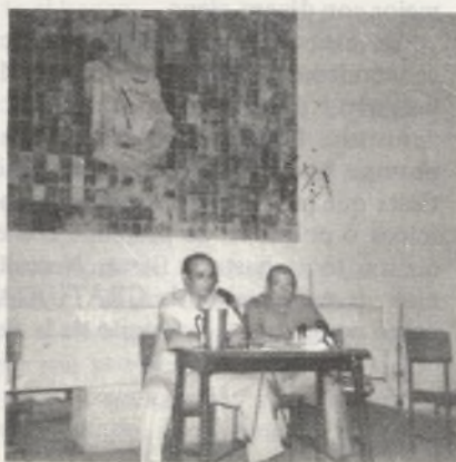
Ayuntamiento de Madrid