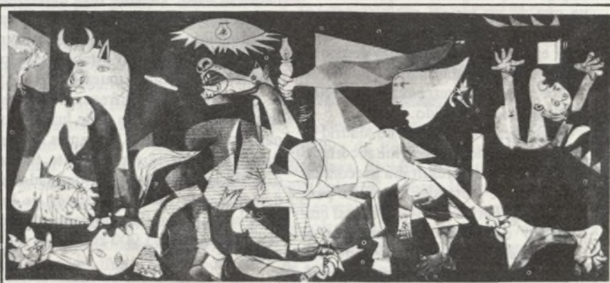
EL "GUERNICA" EN ESPAÑA

El patronato de Casas de la Armada, que por la citada Orden Ministerial tiene la delegación para la representación del Ministerio de Defensa en las gestiones necesarias para la promoción de las construcciones, ha hecho llegar al Ayuntamiento de Madrid la voluntad de dedicar los terrenos de su propiedad en Hortaleza a la construcción de las viviendas de apoyo logístico necesarias, así como a la construcción de un centro escolar.