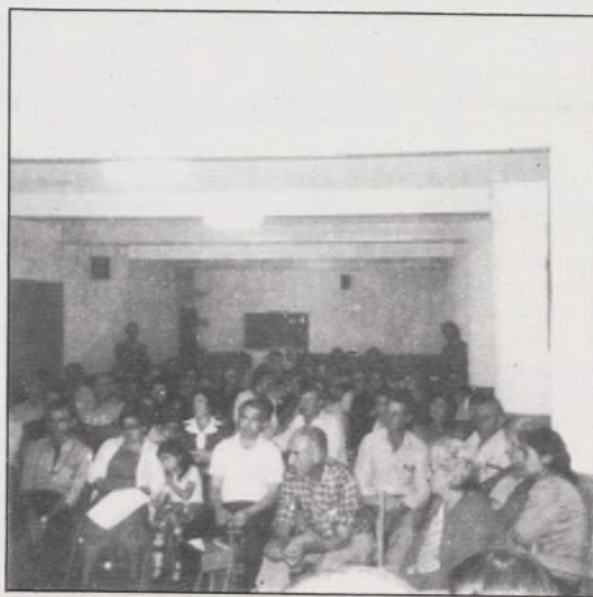
La foto recoge un momento del acto de constitución de la asociación de afectados en Hortaleza, celebrada en los locales de la asociación de vecinos en U.V.A.