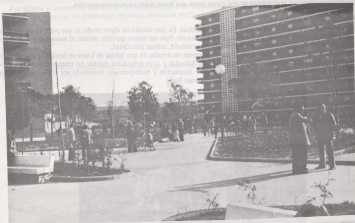
PARQUE VIRGEN DE LA SALUD - SANTA MARIA Ayuntamiento de Madrid