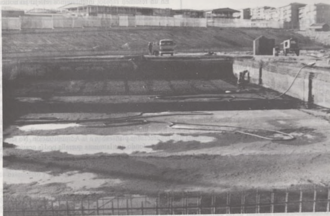
POLIDEPORTIVO HORTALEZA (piscinas)