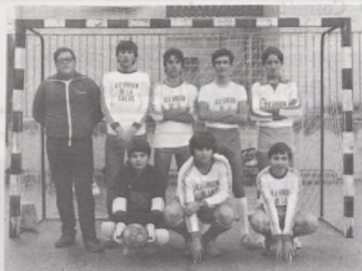
Equipo de fútbol-sala Cadetes de Virgen de la Salud

Orisa: Participó con dos equipos, uno de alevines y otro de infantiles.