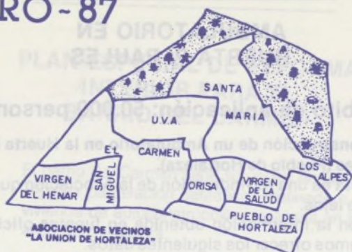
ASOCIACION DE VECINOS "LA UNION DE HORTALEZA"