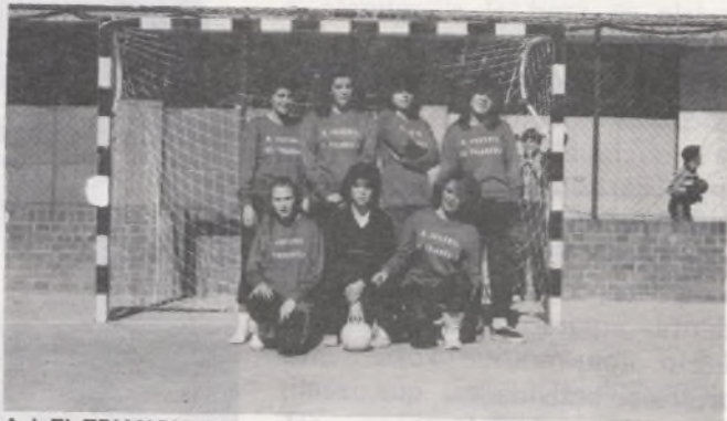
A.J. EL TRIANGULO

Es el único equipo que está al completo y debutan este año en la competición municipal. Está clasificado en segunda posición de un total de 10 equipos participantes. Juegan los sábados por la mañana en el Polideportivo de Villa Rosa.