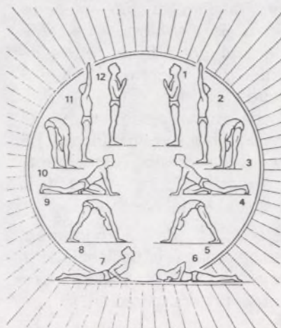
Salutación al Sol (Figura núm. 15)