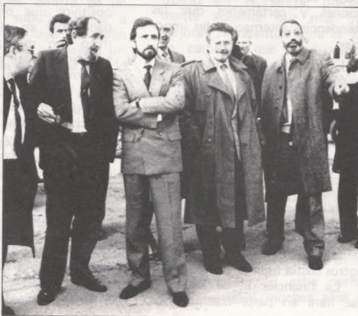
• Autoridades de Madrid visitan las obras del nuevo ferial.

La ejecución de las instalaciones técnicas se efectuará si-