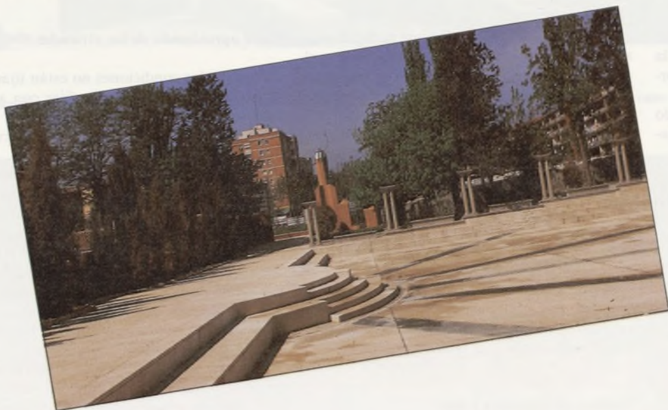
Foro con escenario.