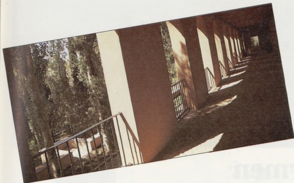
Arcadas del claustro.