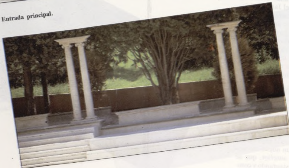
Columnnata del Foro.