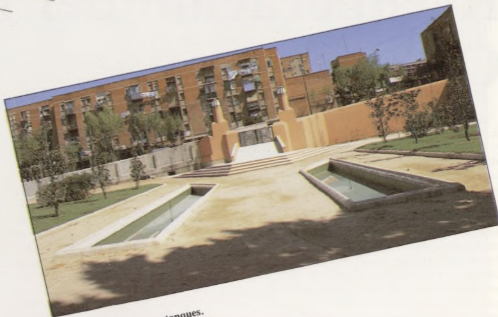
Entrada lateral con estanques.