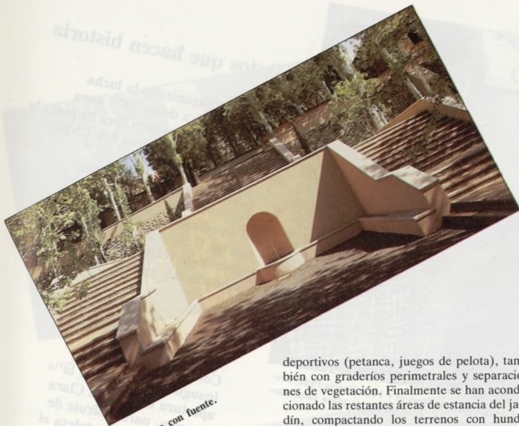
Escalinata con fuente.

consistido, por tanto, en la estructuración de los jardines existentes y en la organización de su conexión con los barrios del entorno. En detalle, las obras realizadas han sido las siguientes: