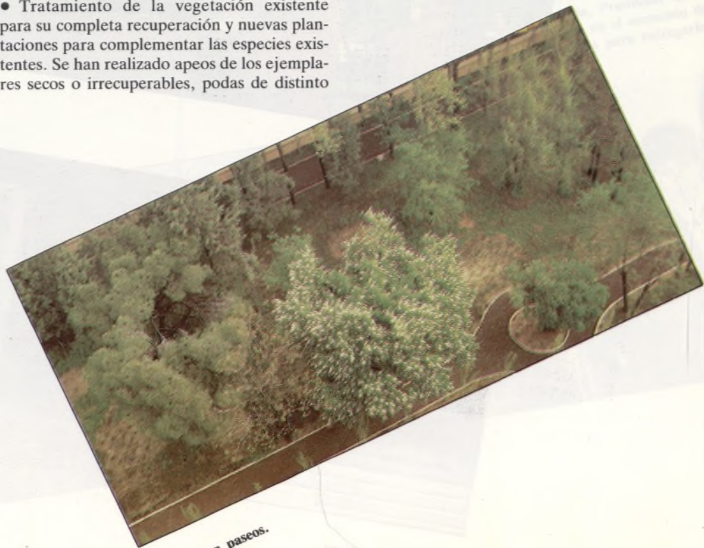
Parque con paseos.

● Integración del parque en su entorno urbano, mejorando los bordes de contacto entre ambos. Para ello se han localizado las puertas de acceso en los puntos más estratégicos para facilitar la relación con los barrios circundantes. El diseño de estos accesos quiere incitar a la penetración en los jardines, con amplios atrios de entrada, que en el caso de la Plaza de los Santos de la Hunosa, incluye el ajardinamiento del espacio urbano colindante, de manera que se prolongue el parque en el ámbito de la calle. Asimismo se ha efectuado la renovación del cerramiento del parque con algunos tramos en forma de mirador hacia el interior, de manera que aunque se proteja la tranquilidad del recinto, sea apreciable su existencia desde el exterior.