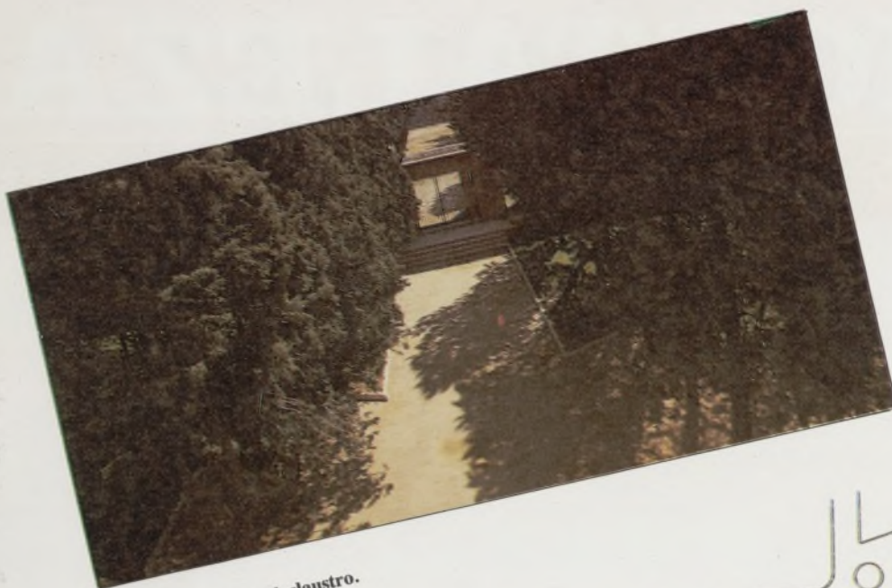
Camino de acceso al claustro.