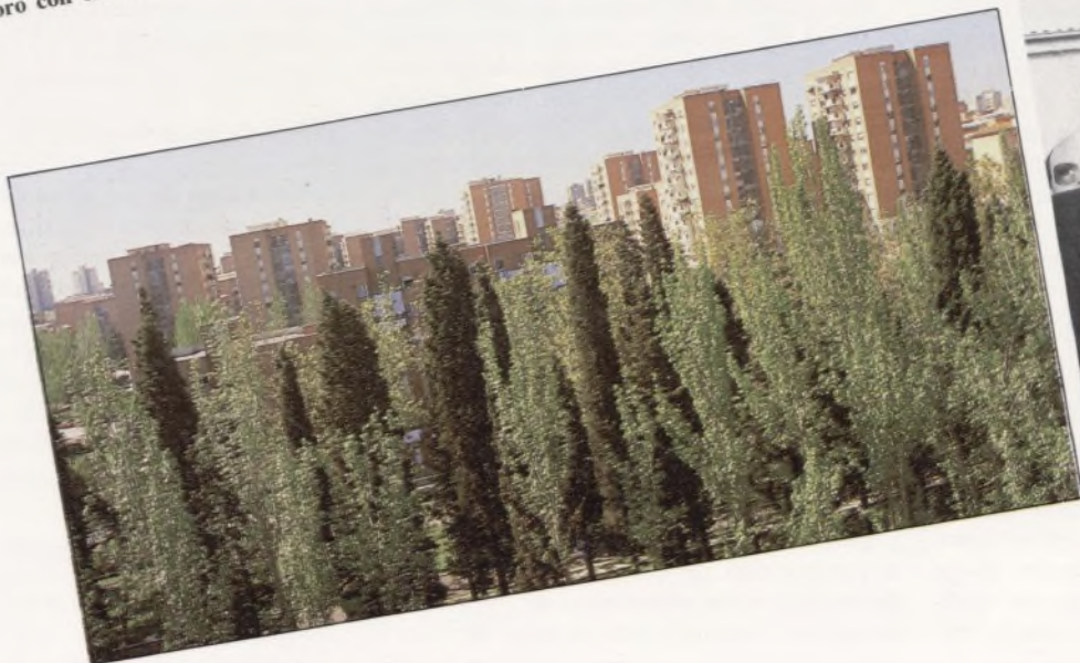
Arbolado del parque.