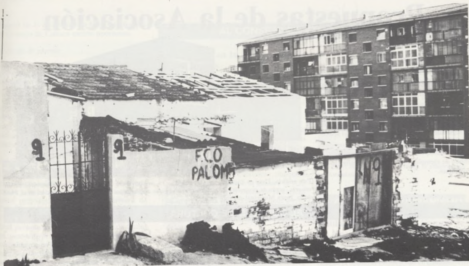
Infravivienda del barrio de El Carmen, que desaparecerá con el Plan de reforma interior, que caba de aprobar inicialmente el Ayuntamiento.