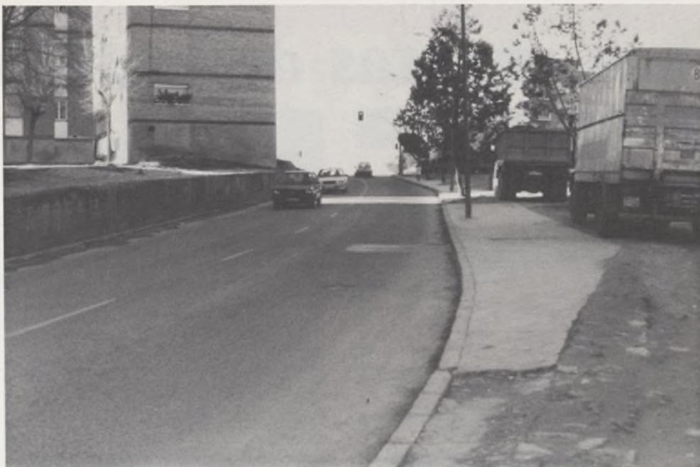
Arreglar los baches de la c/. Mar Menor, en Huerta de la Salud, no está contemplado en los presupuestos.