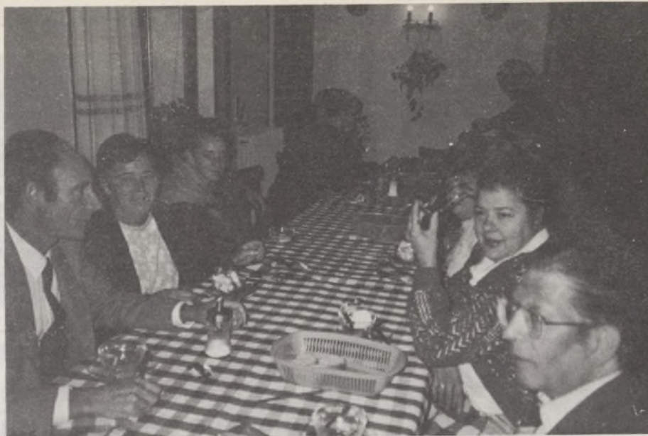
Algunos vecinos del barrio departan amigablemente durante la cena en el hotel de Andorra donde se encontraban alojados.

También es verdad que hasta el momento sólo hemos contado económicamente con la ayuda de los feriantes. Por cierto que éstos