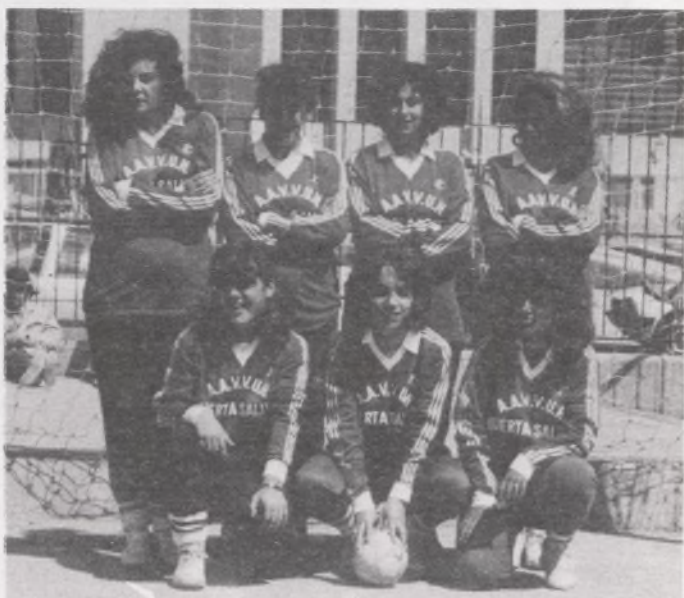
Equipo femenino que fue subcampeón de Distrito. En la foto falta Pili, una de las artífices de esta clasificación.