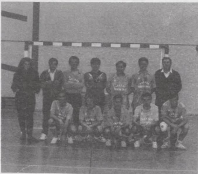
Equipo de Federación que ha ascendido este año de categoría