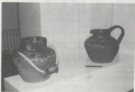
Jarra realizada, en barro refractario con esmaltes de alta temperatura, en el taller de cerámica de Sta. María c/ Sta. Susana, 55

fiables, a la hora de reivindicar y negociar en la Administración el problema de la Vivienda.