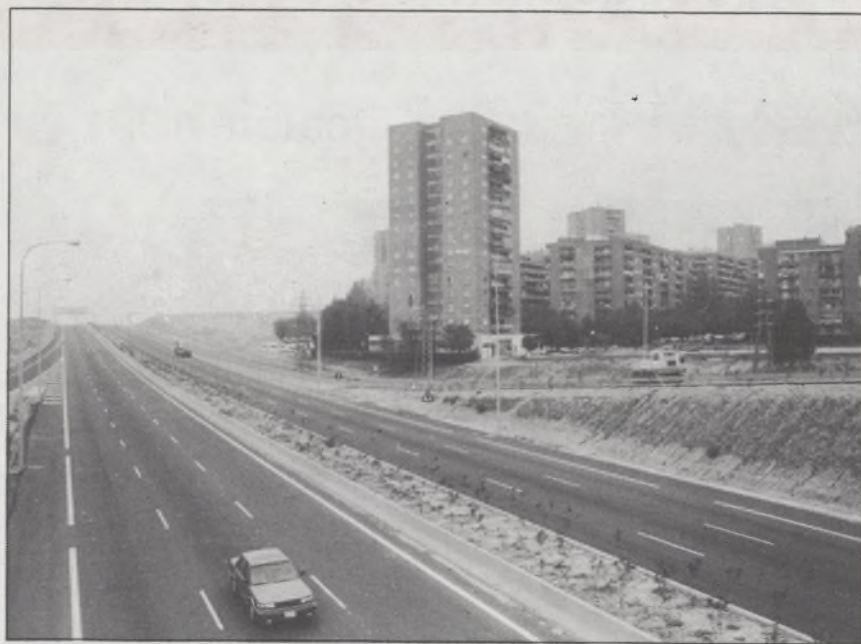
M-40 que para unos supone mejorar la rapidez en la circulación y para los vecinos de Sta. María, supone ruidos insoportables.

Asociación de vecinos "LA UNION DE HORTALEZA"