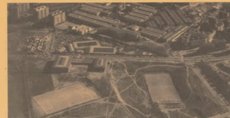
Polideportivo C/ de la Estación

También en esta misma calle las autoescuelas continúan realizando sus prácticas, entorpeciendo la normal circulación de los vecinos y provocando situaciones peligrosas. Insistiremos.