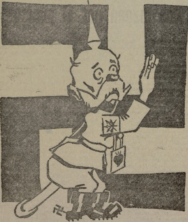
"Una Patria y un caudillo"