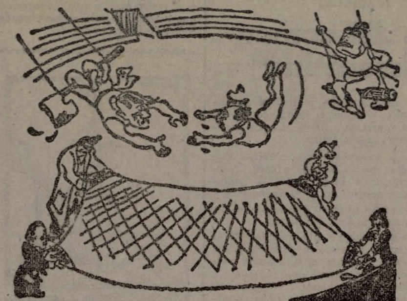
La pirueta mortal