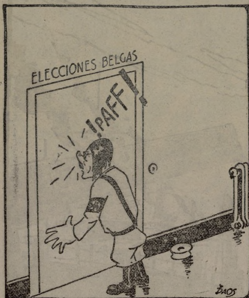
Bsa maldita costumbre...

ER EJERCITO DEL SUR.—Frente de Córdoba.—Por la carretera de Villaharta siguió el avance y empuje de nuestras tropas, que ocuparon varias lomas que flanquean el cerro de Chimorra, continuando la operación para limpiar completamente de facciosos la sierra citada. Por Fuenteovejuna se ocupó, con gran brillantez, la importante posición de Santa Bárbara, infligiendo al enemigo duro castigo. En los demás frentes de este Ejército, sin novedad.