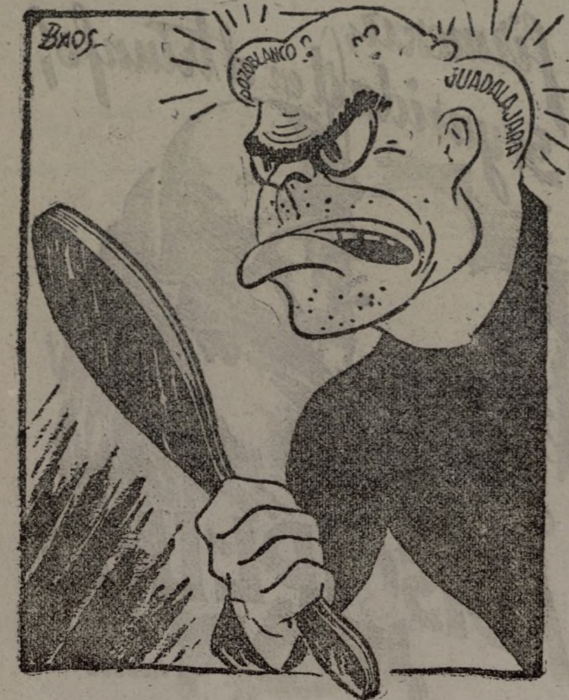
—Buena primavera se me presenta.