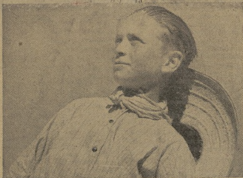
Este muchacho campesino contempla desde tierra un avión republicano. Admira la valentía de nuestros aviadores y quiere ser como ellos

Todos, jefes, soldados, comisarios, más que nadie los comisarios. Todos, absolutamente todos, debemos agrandar nuestra capacidad de sacrificio y de abnegación, nuestra disciplina, porque la situación lo exige y porque la victoria lo merece.