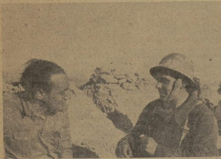
Los obreros de las industrias de guerra, visitando en el frente a los soldados