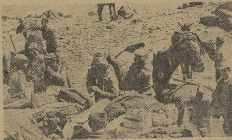
Descargando un convoy en la primera línea

«Tenemos el honor de transmitir el saludo más cordial de los franceses antifascistas de Barcelona, los cuales celebran su llegada a la capital de Cataluña, residencia del Gobierno de la República de España. No podemos por menos de sentirnos contentos de vuestro nombramiento como representante del Gobierno francés al lado del Gobierno español.»