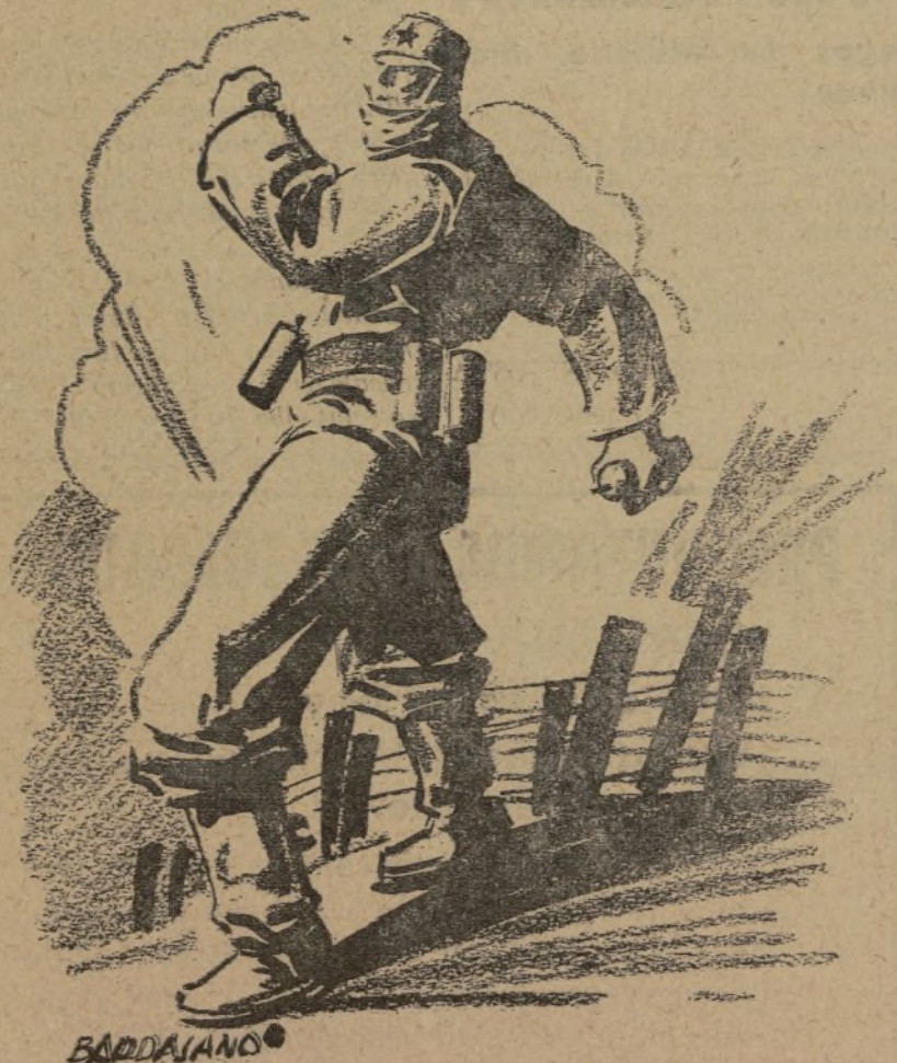
ASI SON NUESTROS SOLDADOS

Los objetivos militares fueron batidos con gran éxito, regresando todos los aparatos sin novedad a su base.