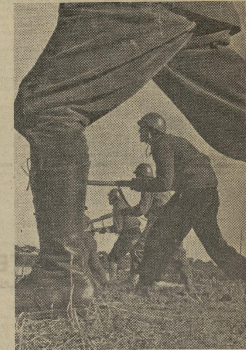
Cuando llegue la hora, el avance de nuestros soldados será arrollador. Bajo las botas de nuestros combatientes quedará aplastado el fascismo.

Los planes trazados, se desenvuelven. Las etapas marcadas, se consiguen; y la fe absoluta de todos en el