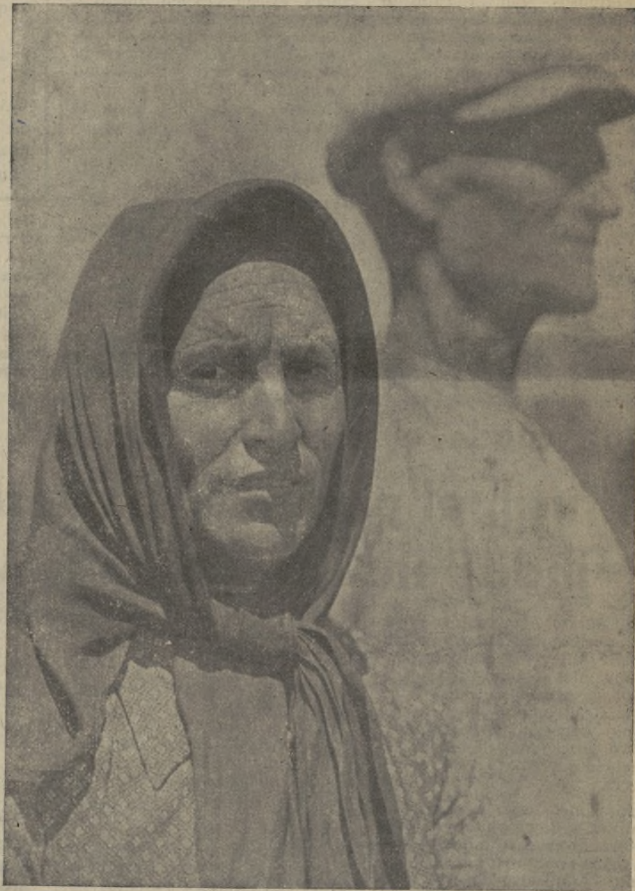
Campeños de España. Enemigos a muerte del fascismo. Trabajadores solidarizados con su Gobierno, cuya respuesta a Inglaterra y al mundo expresa la voluntad de luchar hasta la victoria de todo el pueblo español.

Por último el Gobierno estima necesario que se acelere la resolución del Comité por la cual se autoriza al Presidente a dirigirse al Gobierno y a los rebeldes, con objeto de obtener la conformidad al acuerdo. Debe saberse de manera que no quede lugar a dudas, si tal acuerdo se contrae de modo exclusivo a la retirada de personas de nacionalidad no española que participan en la lucha o también a los otros problemas de reconocimiento de cierto derecho de beligerante y al restablecimiento de la vigilancia terrestre y marítima que con el primero aparecen involucrados.