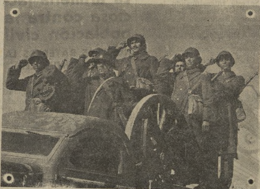
Durante los 5 días de ofensiva victoriosa del Ejército Popular, ellos han hecho posible con su actuación magnífica el avance de la Infantería republicana. En el asedio a Teruel nuestros artilleros juegan ahora el papel más importante. Ayer hicieron blancos inigualables sobre las posiciones enemigas de la ciudad, causando daños enormes a los facciosos y haciendo todavía mayor la desmoralización que invade en estos momentos a los rebeldes de Teruel.