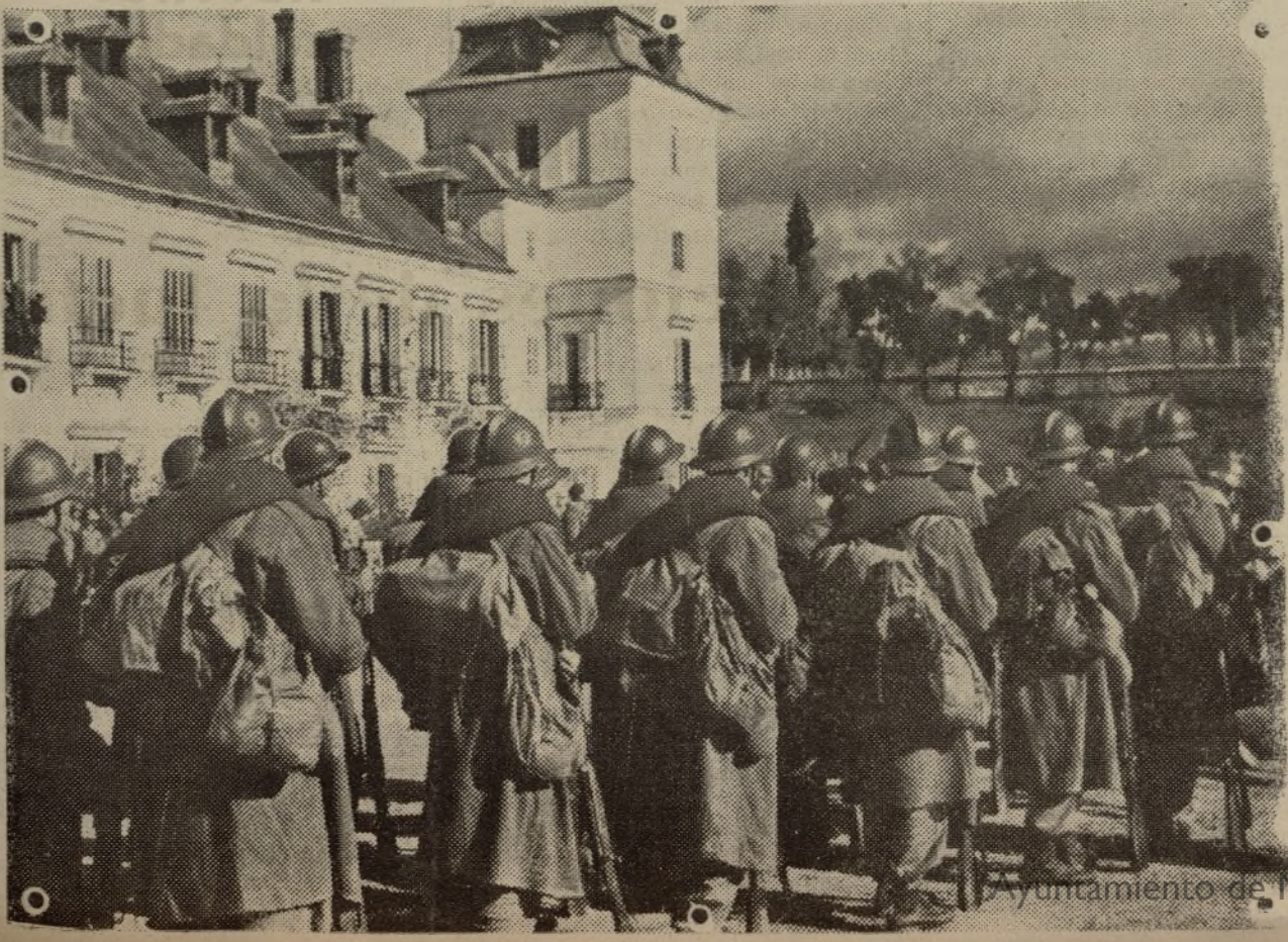
La potencia del Ejército popular hoy, es enorme. Tenemos fuerzas bastantes para terminar hasta la raíz con el enemigo. Después de nuestros soldados que atacan, hay otros dispuestos a atacar. Teruel no ha sido más que el comienzo.

Paris, 27.—Comunican de Berlín a Zurich que durante los ejercicios de prueba de defensa antiaérea, al quedar la población completamente a oscuras, los elementos del Frente Popular se dedicaron a sembrar las calles de octavillas que decían: «Hitler es la guerra, Queremos mantequilla y no cañones. Para salvar la paz hay que quitar a Hitler».