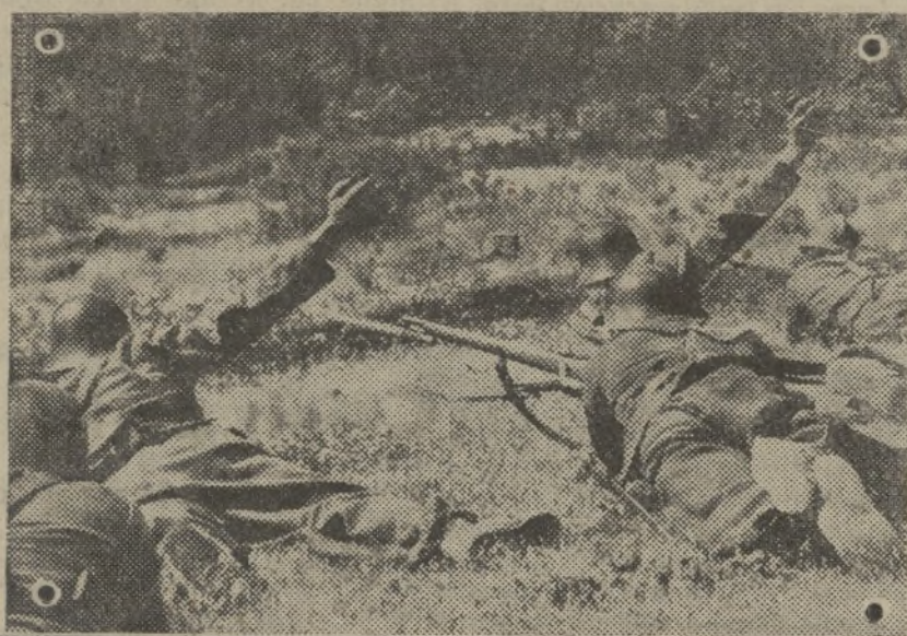
Estos soldados, luego de conquistar Teruel, han estrellado frente a él a los ejércitos fascistas. «Ni un paso atrás» es la decisión suya contra la que el enemigo se ha desangrado una y otra vez.

En los demás ejércitos sin noticias de interés.