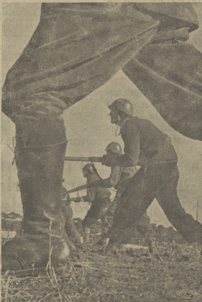
Nuestros soldados, los soldados del Ejército Popular, atacan y avanzan. ¡Adelante hasta terminar con el enemigo!

LEVANTE. — Hoy ha continuado el combate en los sectores de Singra y Celadas, conservando las fuerzas leales la iniciativa de la operación. EXTREMADURA. — Se ha reanunciado a vanguardia nuestra línea del sector de Villanueva de la Serena (Badajoz). En los demás Ejércitos sin novedad.