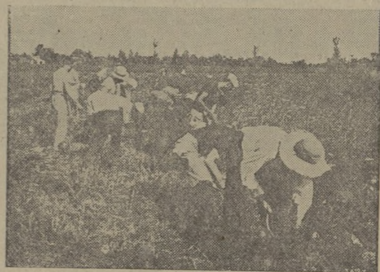
Brigadas de choque en el campo para corresponder al esfuerzo de los combatientes y contribuir a la resistencia de hoy que hará posible nuestro ataque luego.

Hasta el día 30 inclusive de este mes podéis enviar vuestros trabajos sobre uno de todos estos temas a nuestra Redacción, con la indicación en el sobre «Para el concurso de VANGUARDIA», firmados por vosotros y con las señas de la unidad a que pertenecéis y lugar donde os encontráis en la actualidad.