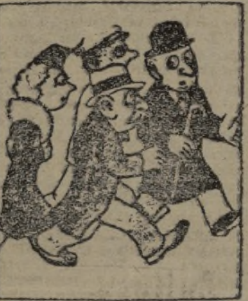
—Un perro que ha puesto un nuevo...