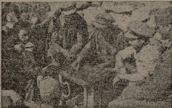
¡Capacitación intensa de nuestros mandos y de nuestros soldados, aprovechando todos los momentos propicios!

VANGUARDIA confía en contar con esta colaboración, para que el Diario del Ejército de Levante refleje y destaque las actuaciones heroicas de sus combatientes, que se reproducen día tras día en las duras jornadas que atravesamos.