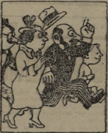
—En marcha, amigo...