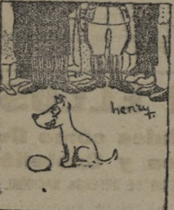
—Lo he hecho en un momento, pero la gallina...