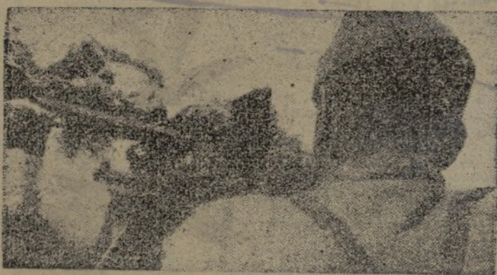
¡Pulso firme para deshacer al invasor!