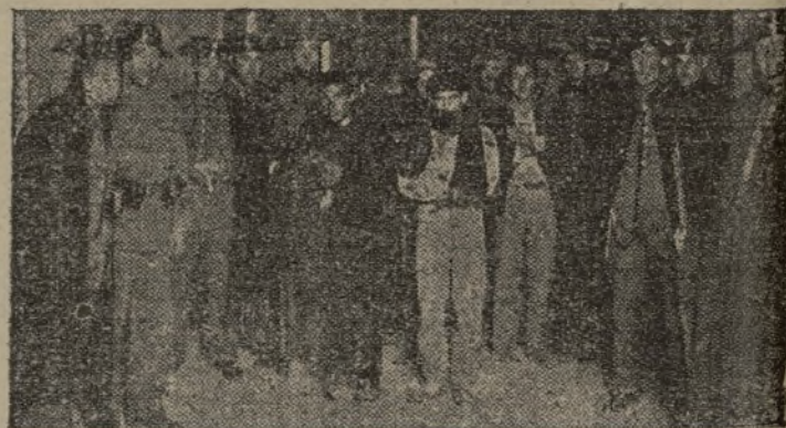
LUCHAMOS POR QUE ESTO NO VUELVA

que les demos prácticamente que estamos a su lado. Sobre todo, los combatientes. ¿Cómo? Los mutilados e inválidos, en su Pleno, han agradecido al Comisariado del Ejército de Levante la ayuda que desde un comienzo les ha prestado, facilitándoles la publicación de su órgano periodístico y prestándoles todo apoyo en su trabajo. He aquí un magnífico ejemplo de ayuda que todos nuestros combatientes deben secundar. Ayuda inmediata del Ejército a los mutilados a través de su organización única: la Liga Nacional que lleva la dirección y organización del movimiento de mutilados e inválidos en toda la España republicana.