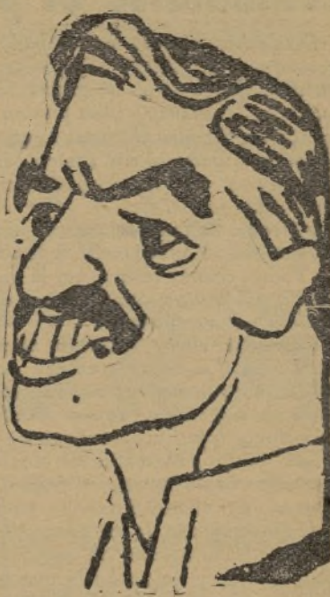
UN ENEMIGO DE ESPAÑA