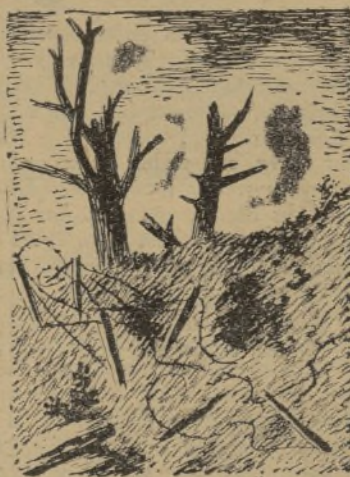
Ramón González Peña

He aquí un auténtico proletario, minero asturiano y presidente querido de la Unión General de Trabajadores de España, la gloriosa sindical española que ayer cumplió el cincuenta aniversario de su constitución.