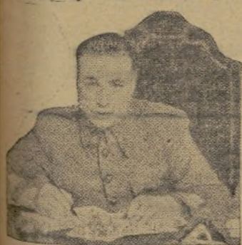
EL ORGANIZADOR DE LA RESISTENCIA EN LEVAN- TE, CEREBRO AL SERVI- CIO DE ESPAÑA, CORO- NEL MATALLANA

El enemigo, que alienta bajo el calor de fuerzas italianas, que constituyen sus reservas estratégicas, ha volcado sobre algunos puntos del frente de Levante millares de italianos que, bajo el mando del general Fiazzení y de otros italianos que dirigen las divisiones «Littorio», «Flechas negras», «23 de marzo» y «Flechas azules», buscaron inútilmente una brecha por donde avanzar hacia Valencia. Su avance fué, primero, difícilísimo; más tarde, casi imposible; últimamente, imposible. Una línea defensiva, preparada oportunamente por mi Estado Mayor, constituyó una muralla que se eleva amenazadora y ante la que quedaron millares de hombres que pretendían asaltarla. Italia y España estuvieron frente a frente en Levante y los españoles quebraron el acero de sus enemigos, que supieron de bajas por millares y de esfuerzos estériles. Esa línea, que representa para Valencia su seguridad, tiene para mí