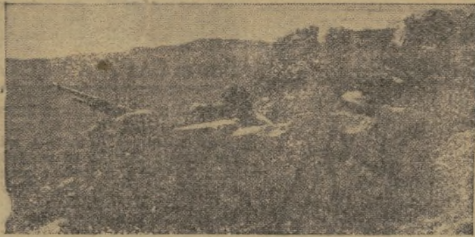
ANTIACIONISTAS FIRMES Y AUDACES DE CARA A LA AVIACION ITALO - GERMANA