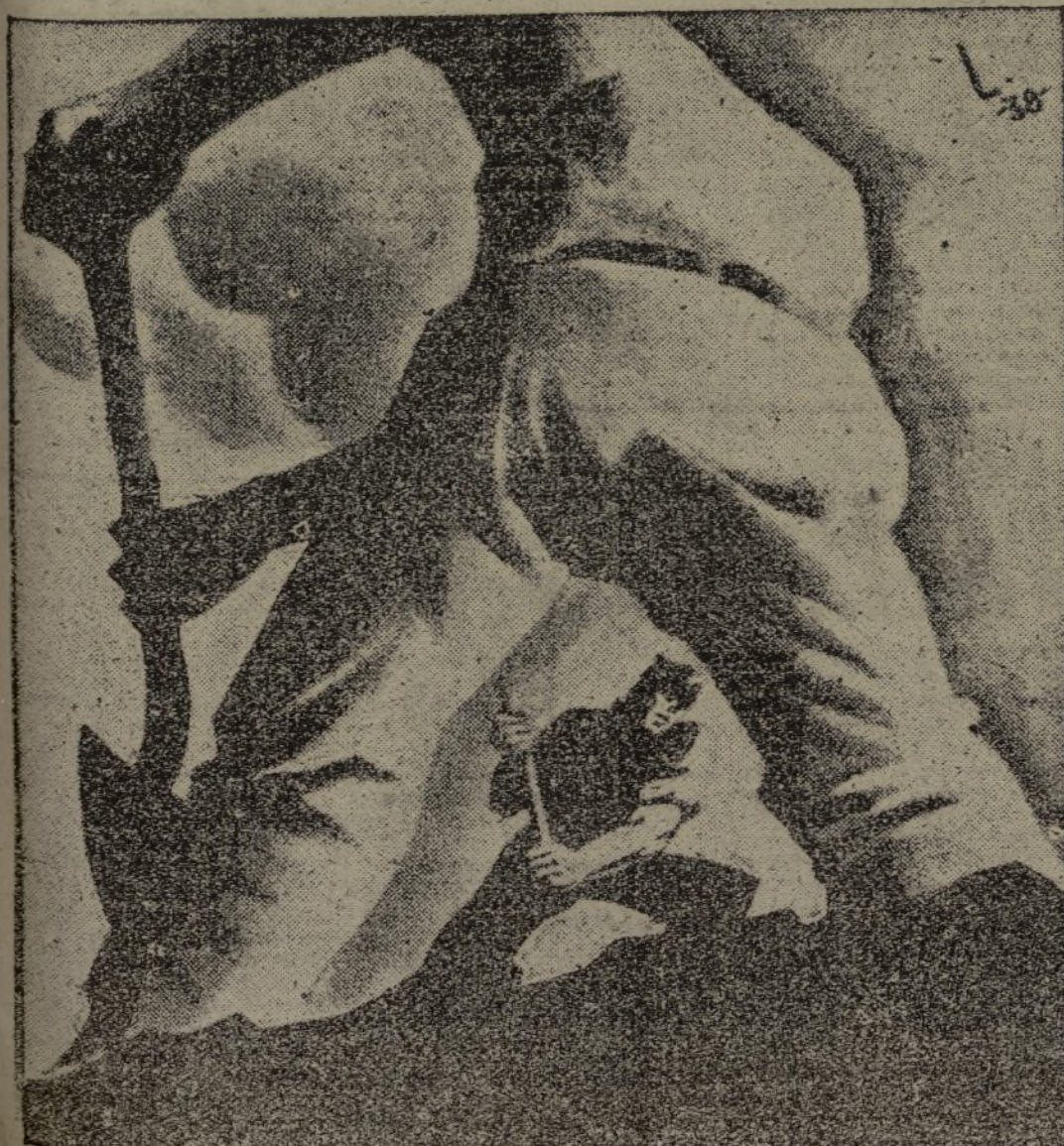
Ayuntamiento de Madrid

Tenemos el caso de esta compañía de panificación, que es una muestra de cómo un soldado sabe rebasear el cumplimiento de su deber limitado. Los camaradas de esta compañía de panificación, calladamente, en el silencio fecundo de su enorme esfuerzo, elaboran nada menos que 28.000 raciones de pan diariamente, como promedio. He aquí un ejemplo de cómo se debe trabajar en la retaguardia del Ejército Popular. Es la fe de que hablaba Negrín, en un memorable discurso, lo que mueve y pone en pie al entusiasta de estos camaradas. La fe en el triunfo del pueblo que lucha por su porvenir.