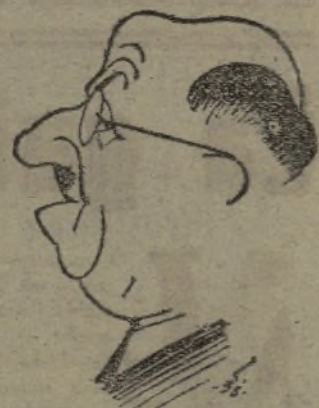
EL Sr. AVENOL

El 9 de septiembre se reunirá en Ginebra la CII Consejo de la Sociedad de Naciones, de la que el señor Avenol es secretario general. Tres días más tarde comenzará sus deliberaciones la Asamblea general, a cuyas reuniones el Gobierno de la República española enviará la delegación cuya composición se aprobó en el Consejo de ministros de ayer.