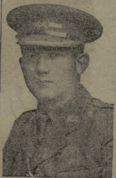
EL MAYOR LOZANO

Después, Madrid, Aranjuez... Una muestra de su audacia. An-