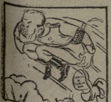
Queipo.—Y yo que desde lo que me pasó a Sanjurjo y a Mola, juré que no volaría jamás.

Respecto de las vacaciones retribuidas hace saber que cada obrero deberá entregar para Defensa Pasiva el importe de un jornal por cada semana que se cobre de vacaciones. Los Comités de enlace de industria serán los encargados de hacer cumplir este acuerdo, dando de tiempo a los afiliados, por la necesidad urgente de continuar los trabajos de refugio, hasta el 15 de septiembre, a fin de que Valencia tenga la suficiente garantía de poder albergar a toda la población en los momentos de bombardeo.—Febus.