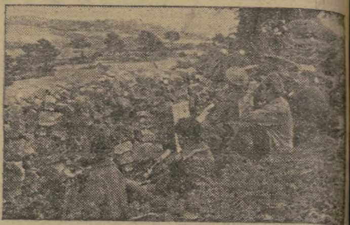
Una escena de las trincheras del frente de Levante