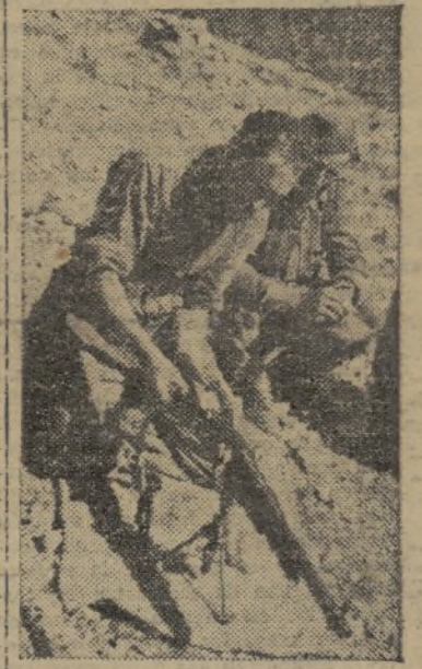
Bien engrasadas y dispuestas las máquinas para la defensa de la tierra española

En Extremadura, en un combate aéreo fueron derribados el día 2, cinco cazas «Fiat». Por nuestra parte sufrimos la pérdida de cuatro aparatos, alguno de cuyos pilotos cayeron en territorio propio.