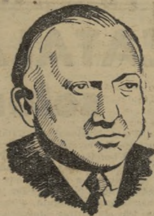
V. M. Orlov COMANDANTE DE ESCUADRA, JEFE DE LAS FUERZAS NAVALES DE LA ARMADA ROJA

Sin estruendo, silenciosamente, la Unión Soviética ha ido mejorando sus efectivos navales. Así llega este momento en que Alemania, al revisar la potencia militar de los que serían sus enemigos en guerra, reconoce que la U. R. S. S. es la primera potencia del mundo en submarinos. 170 tiene en servicio. Le sigue un país fascista, Italia, con 88. Estados Unidos, con 84. Francia, 79. Japón, 74, y con cincuenta y tantos Inglaterra y Alemania. En construcciones de otro tipo, la U. R. S. S. estará rápidamente en condiciones de igualdad respecto de las demás primeras potencias del mundo.