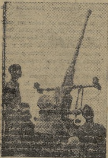
Los pilotos extranjeros tam- bién conocen y temen el fue- go de nuestros antiaéreos

Añadió el coronel Casado que ha- ce unos días nuestras fuerzas han logrado la destrucción de una com- pañía enemiga de especialidades de nombrada «Los Hijos de la Noche». En nuestro poder quedó una consi- derable cantidad de material béli- co.—Fébus.