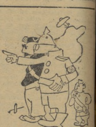
FRANCO.—¡Qué gran militar soy!